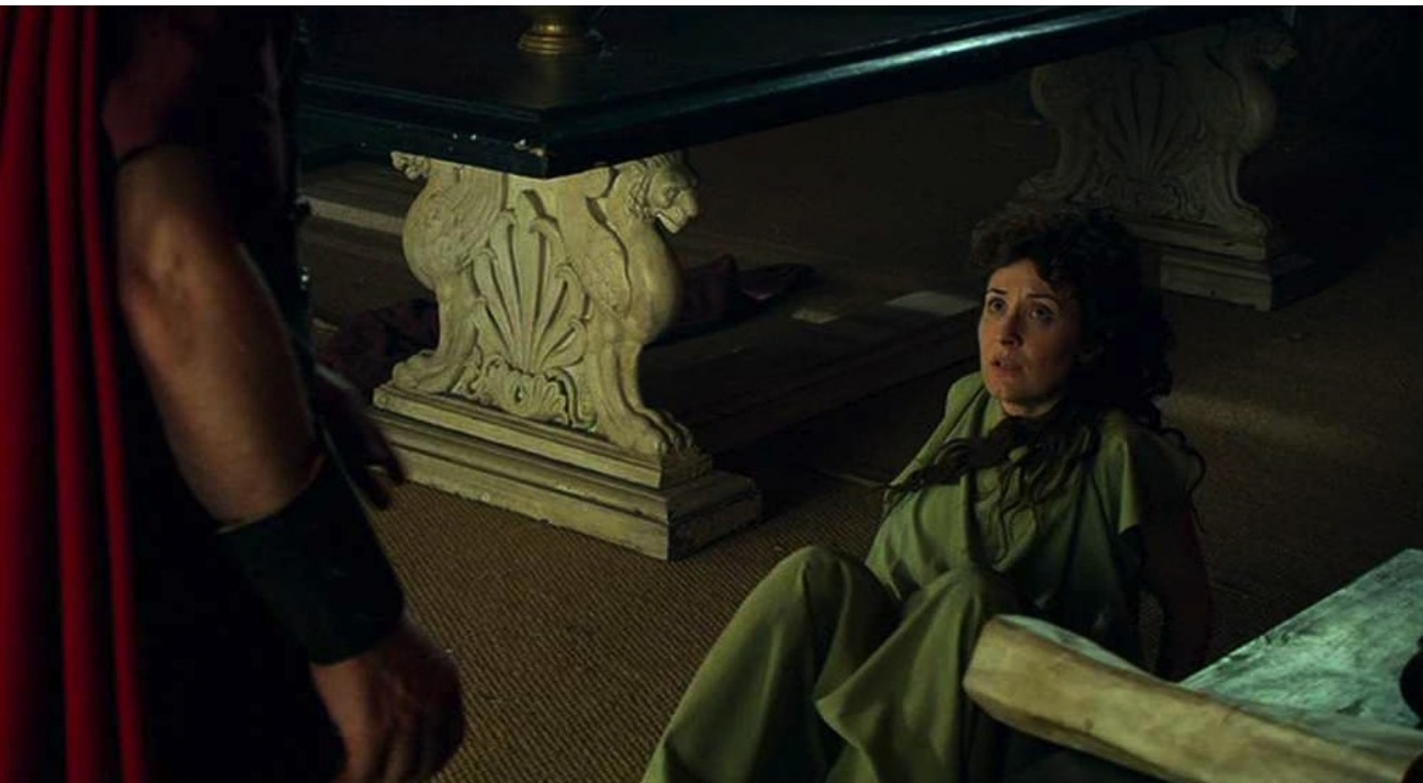
Hispania, la Leyenda : Furieux, il jette son épouse à terre...