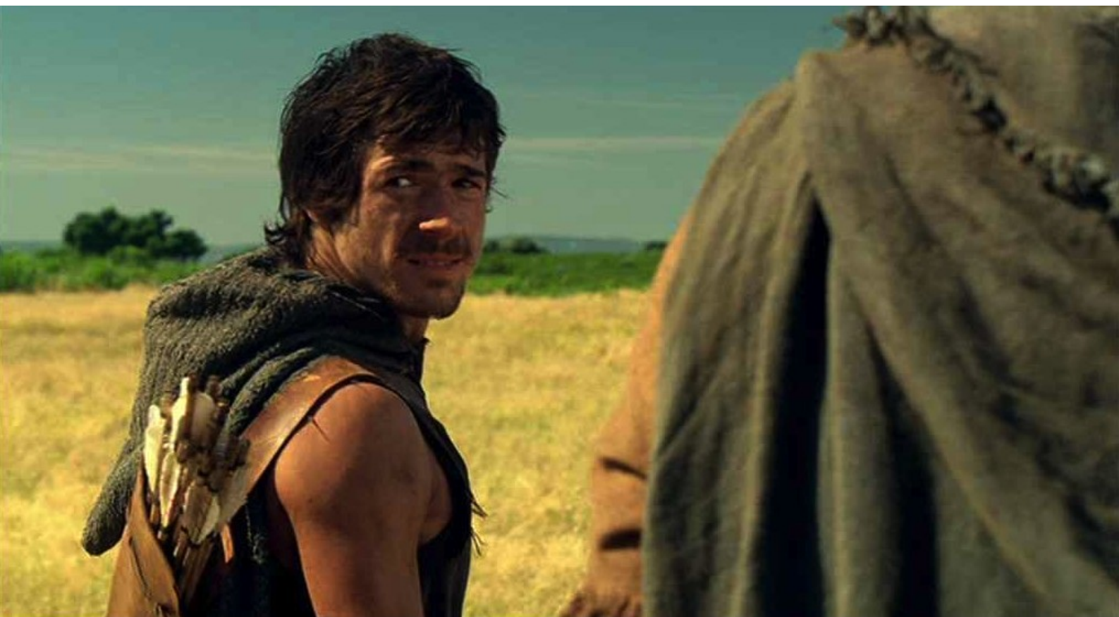
Hispania, la Leyenda : Mai, au moment où Paulo vient de sortir du camp, il entend...