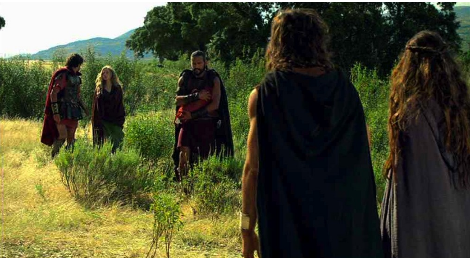
Hispania, la Leyenda : Viriate retourne au repaire assombri par son demi-échet,