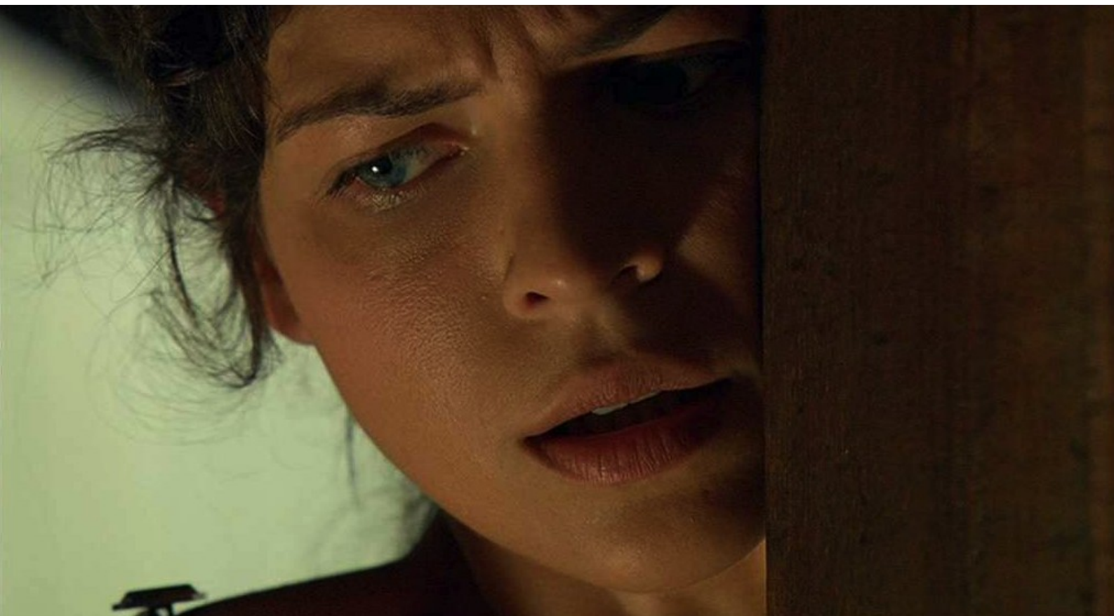
Hispania, la Leyenda : et s'apprête à la supplicier, attachée à un poteau,