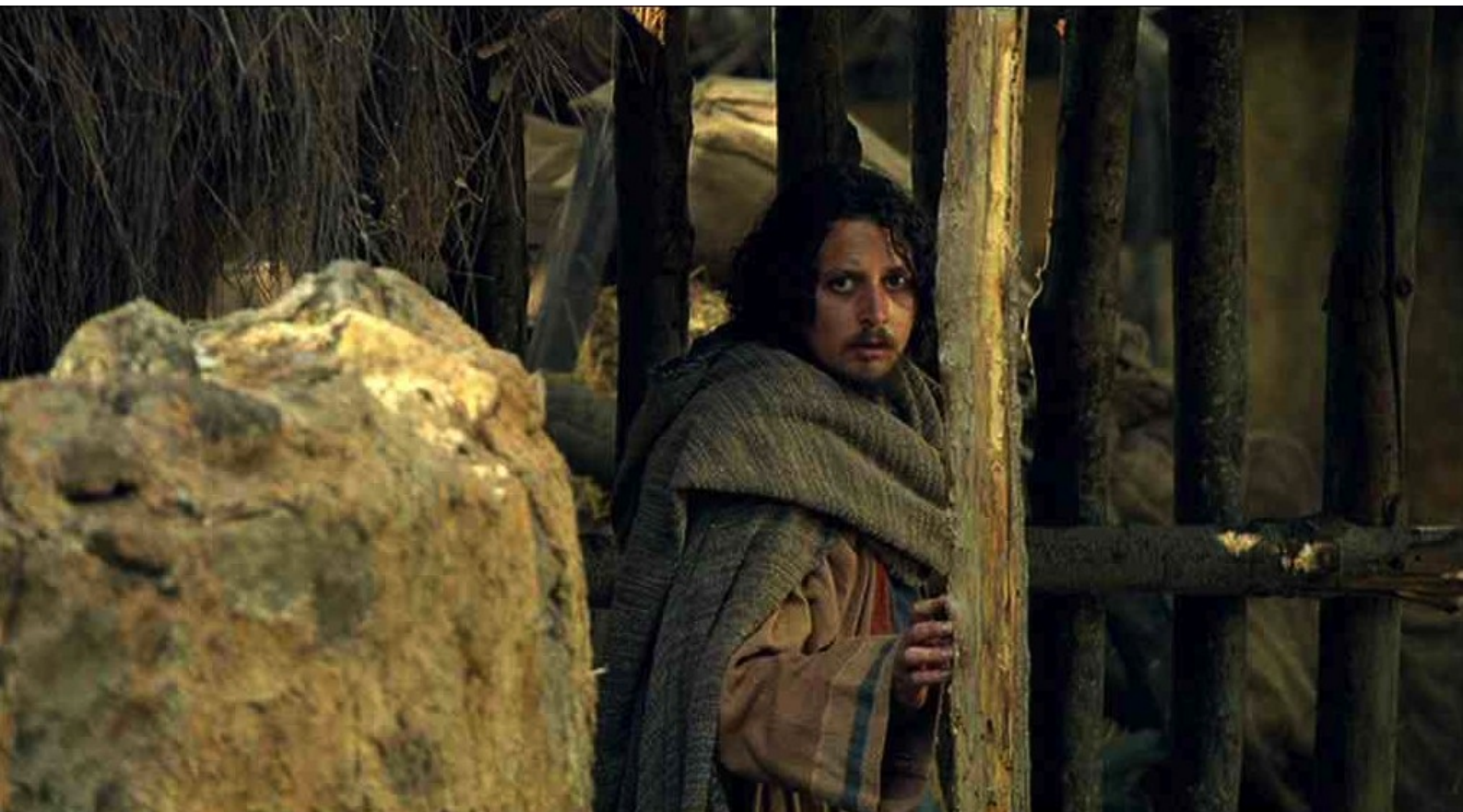
Hispania, la Leyenda : Mais, se rendant compte qu'ils ont été repérés par un espion,