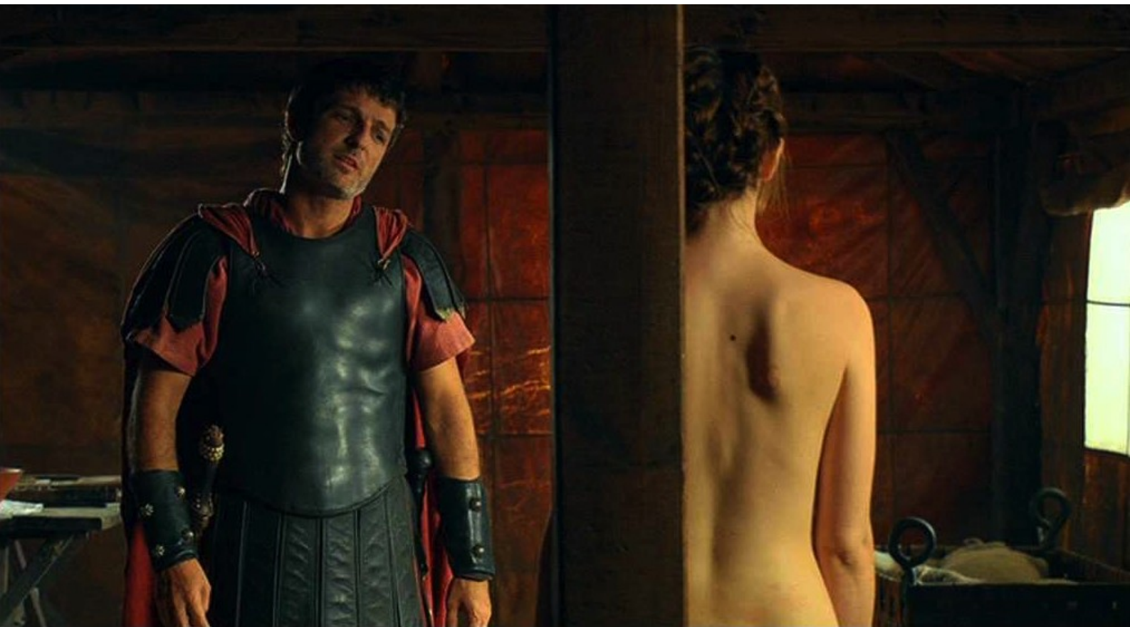
Hispania, la Leyenda : devant Marco,