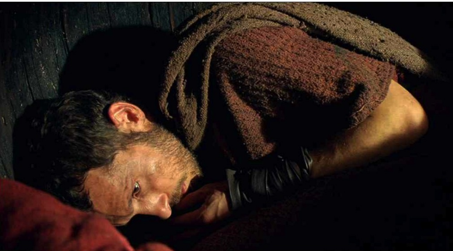
Hispania, la Leyenda : Hector doit se dissimuler dans une cuve.