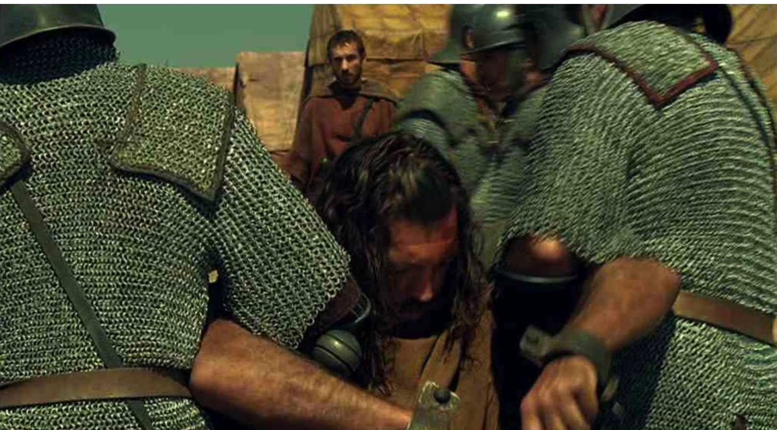
Hispania, la Leyenda : puis, assommé, est rapporté à sa prison...