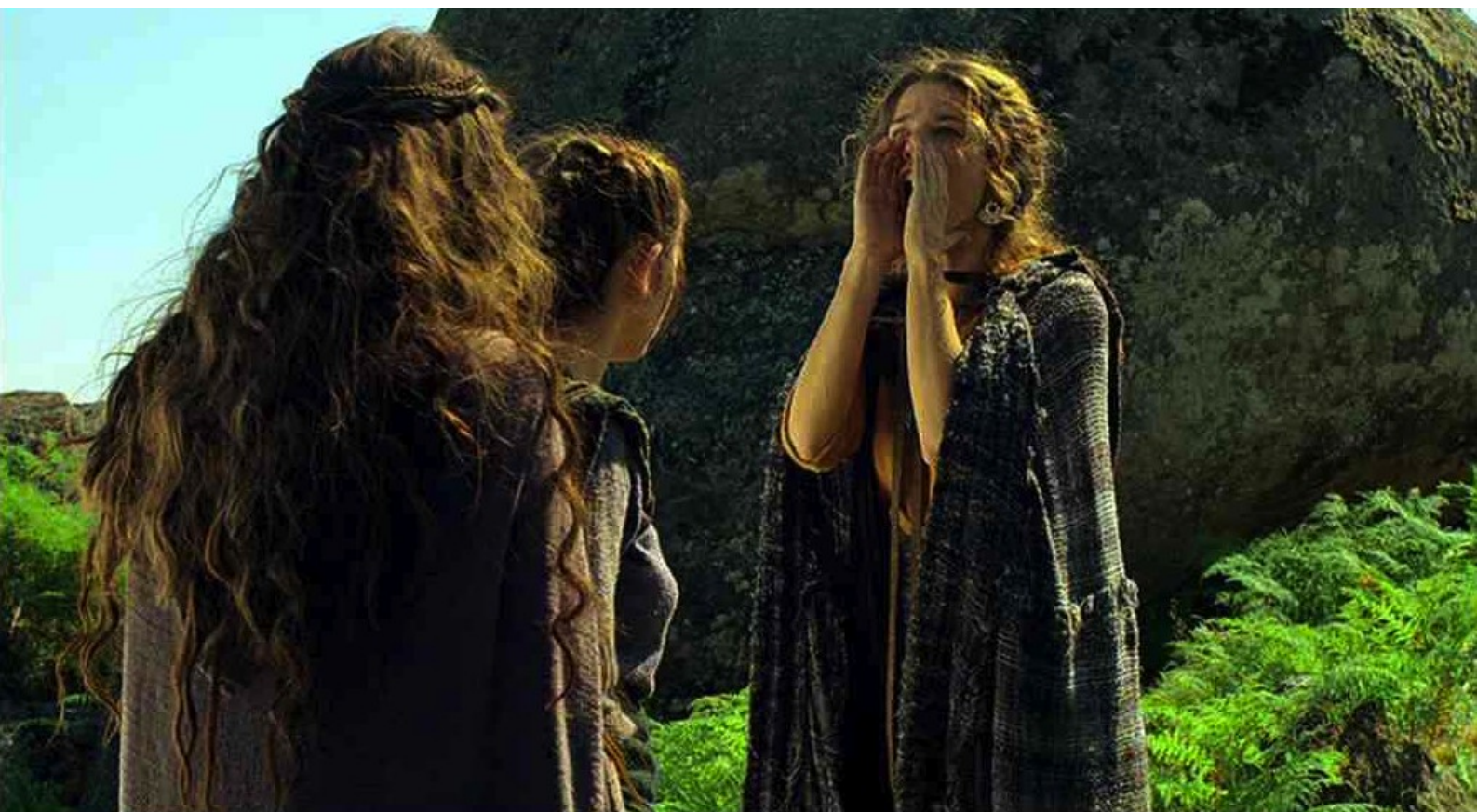
Hispania, la Leyenda : alors la prostituée essaie de héler Viriate,