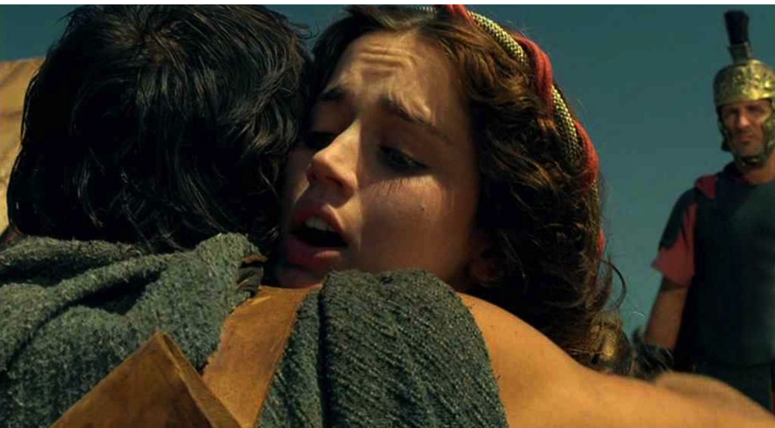
Hispania, la Leyenda : et la jette dans les bras de son fiancé,