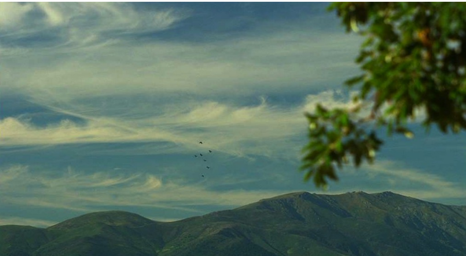
Hispania, la Leyenda : que les Romains lâcheront des oiseaux si Galba accepte les conditions.