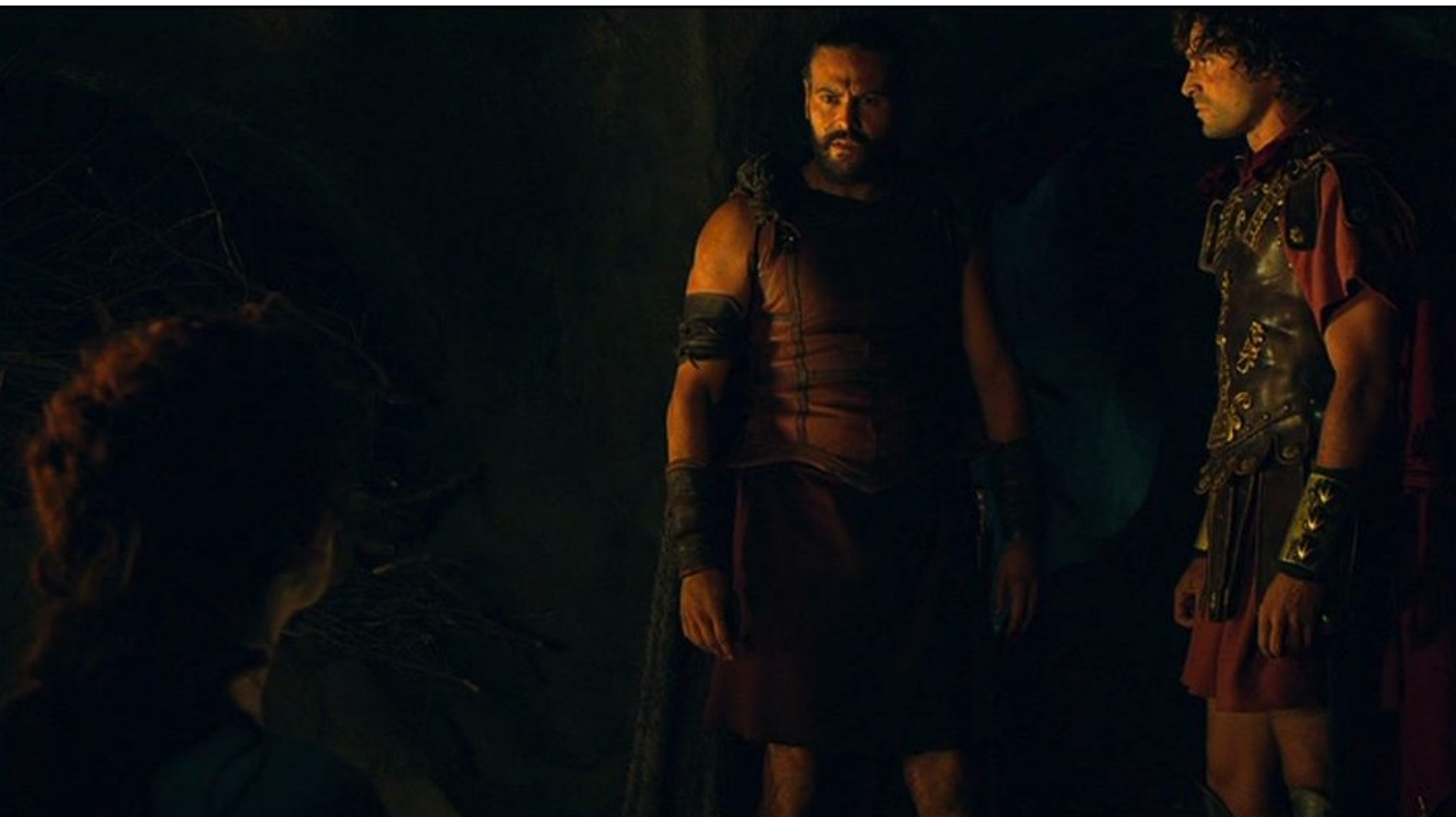
Hispania, la Leyenda : mais survient Viriate, qui oblige...