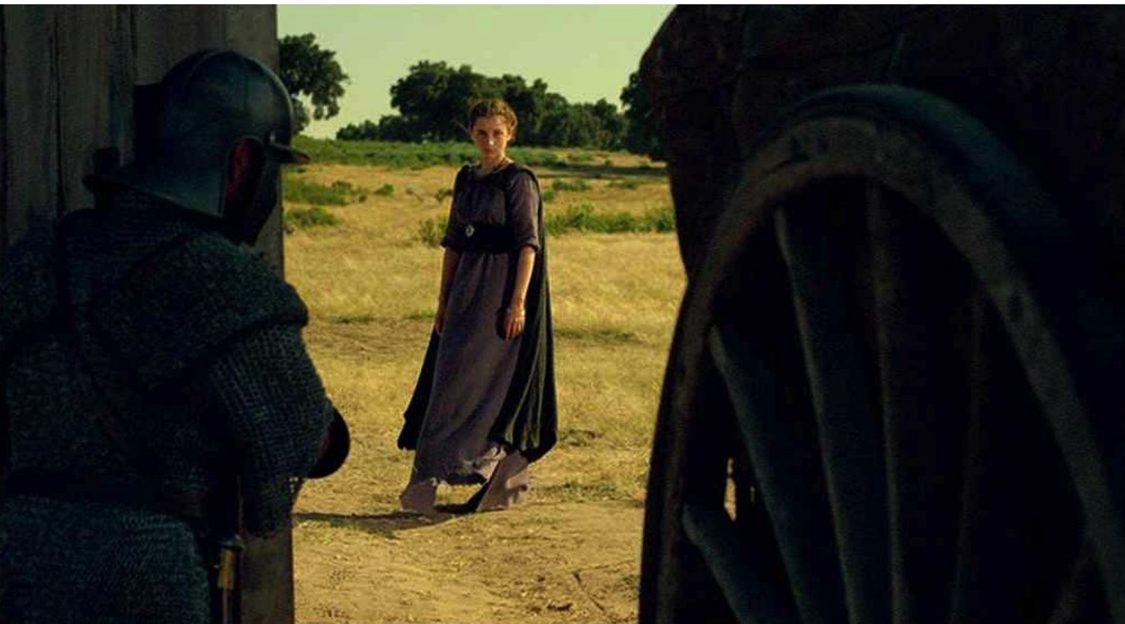
Hispania, la Leyenda : puis hors du camp ;