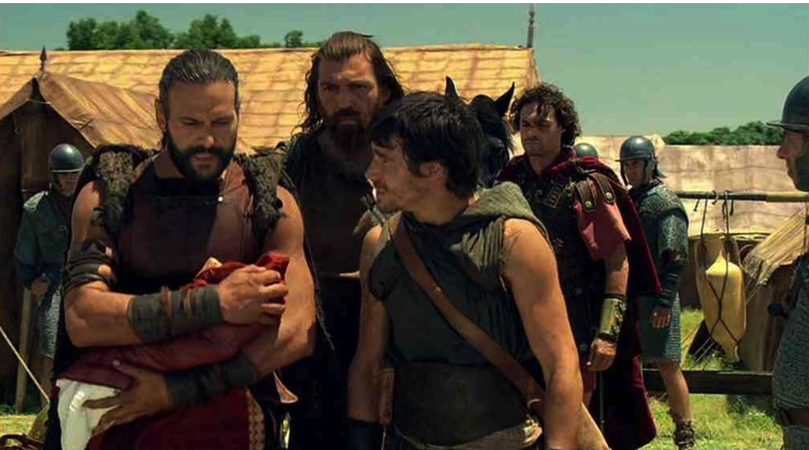
Hispania, la Leyenda : Mais voilà que Viriate emporte Serbal à travers le camp...