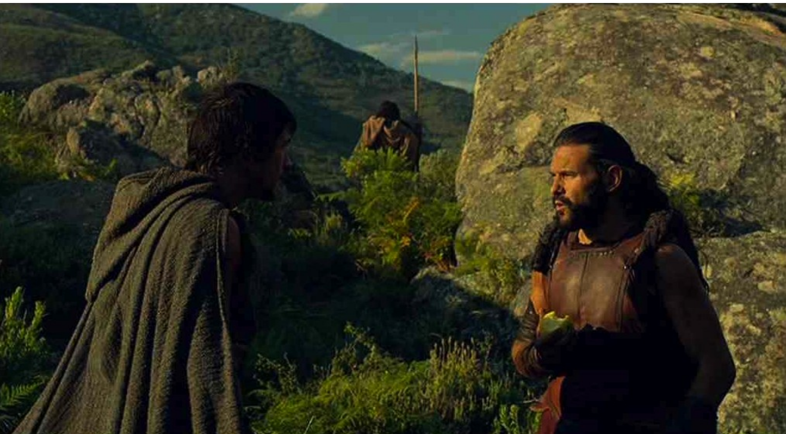
Hispania, la Leyenda : où on lui annonce que personne ne l'a vue :