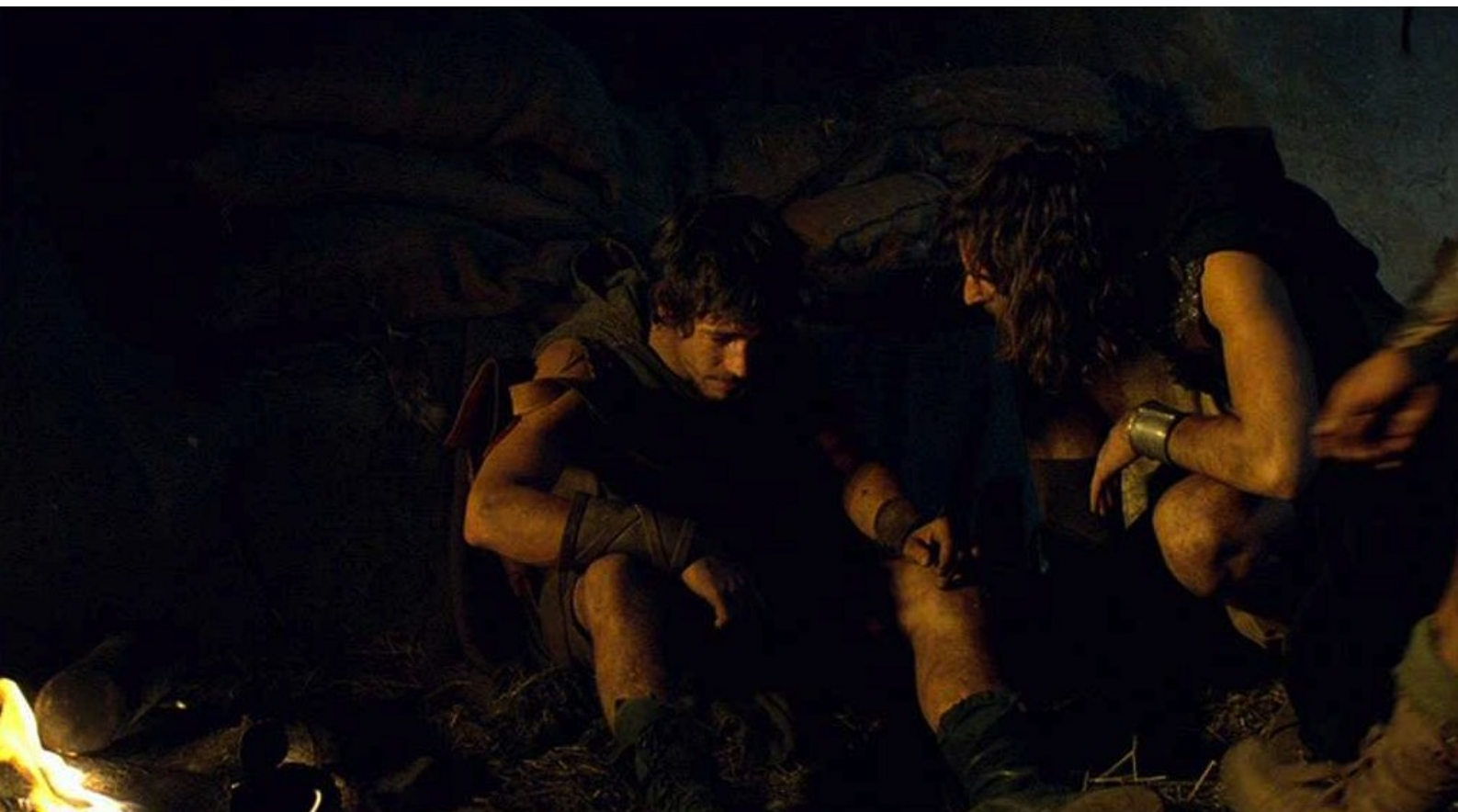
Hispania, la Leyenda : et Paulo y revient aussi, blessé.