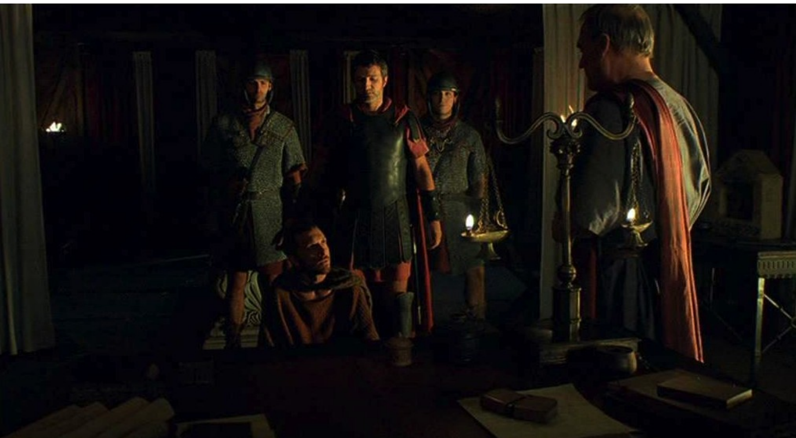
Hispania, la Leyenda : Traîné devant Galba,