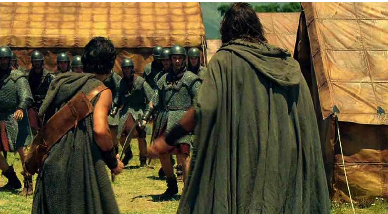
Hispania, la Leyenda : et, accompagné de Sandro, se trouve face à des soldats :