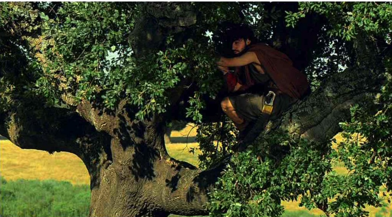
Hispania, la Leyenda : Alors, comme un guetteur les voit sortir par la porte,