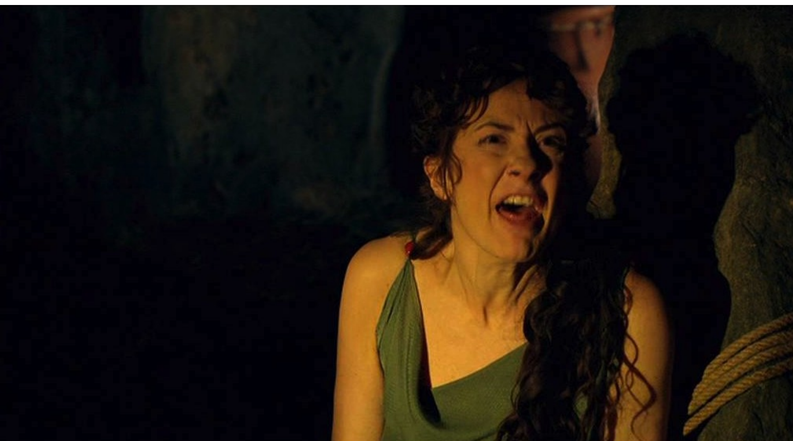
Hispania, la Leyenda : la patricienne à avouer que c'est elle qui a poignardé Galba (épisode 9),