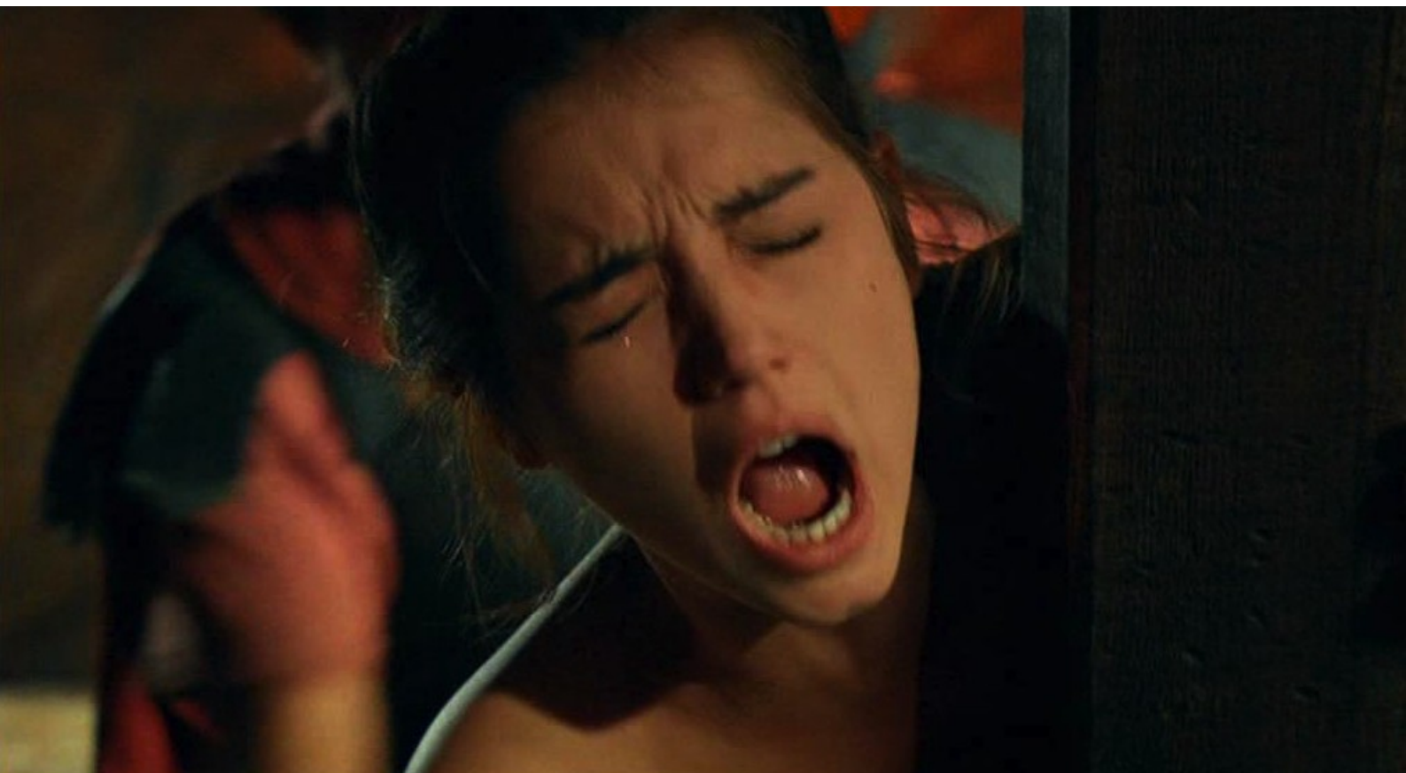
Hispania, la Leyenda : qui la roue de coups.