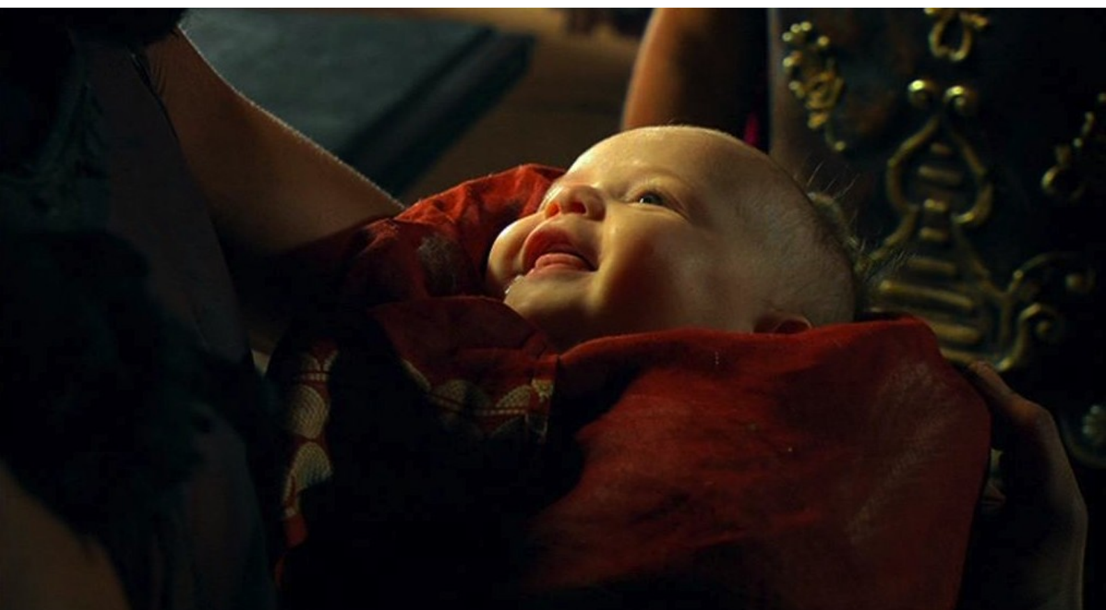
Hispania, la Leyenda : Rendu à son père, Serbal fait une risette,