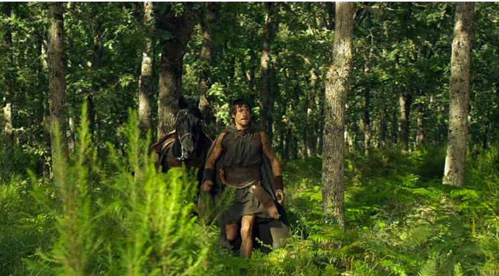
Hispania, la Leyenda : De son côté, Paulo, arrivé au rendez-vous,