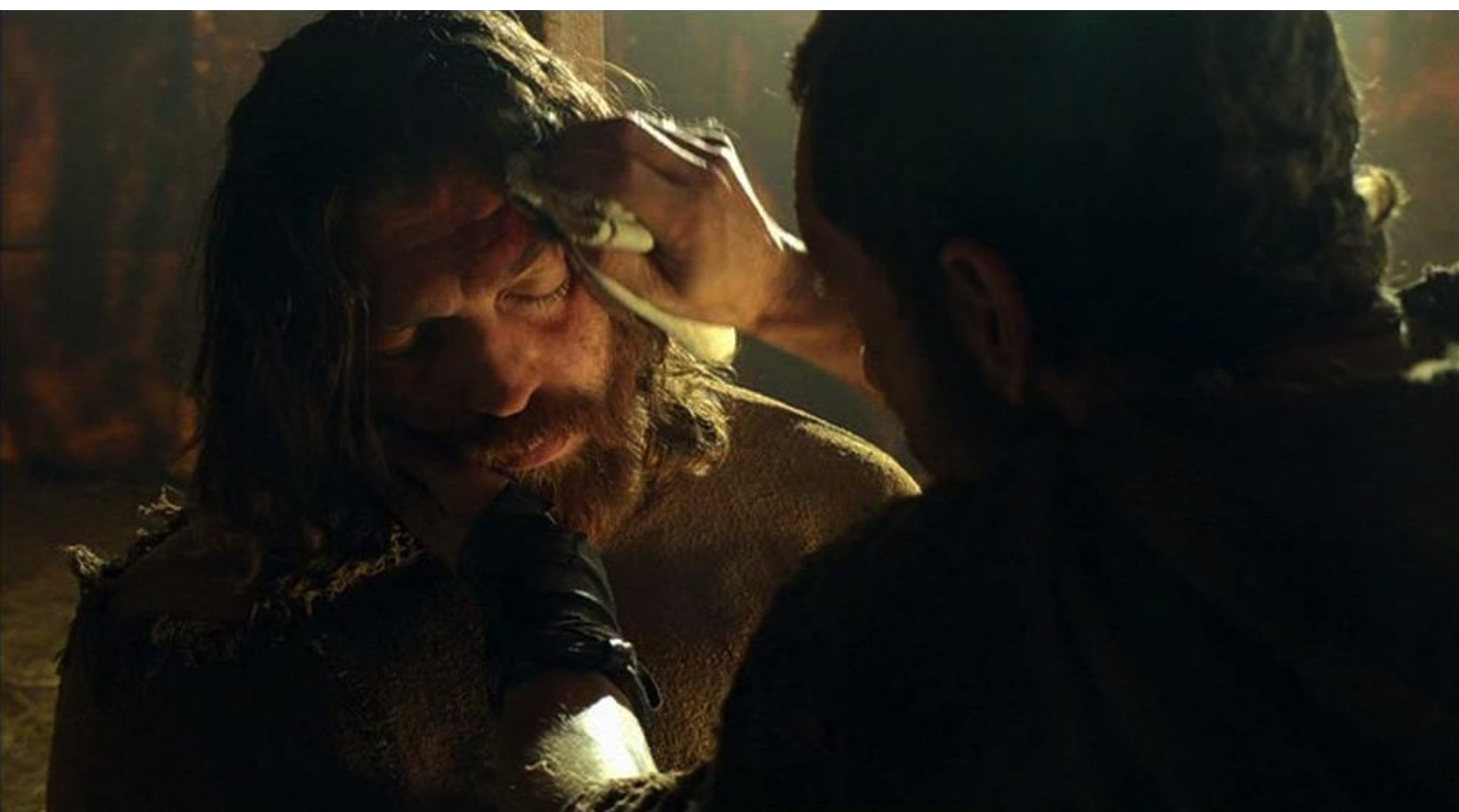
Hispania, la Leyenda : qui va soigner son frère ;