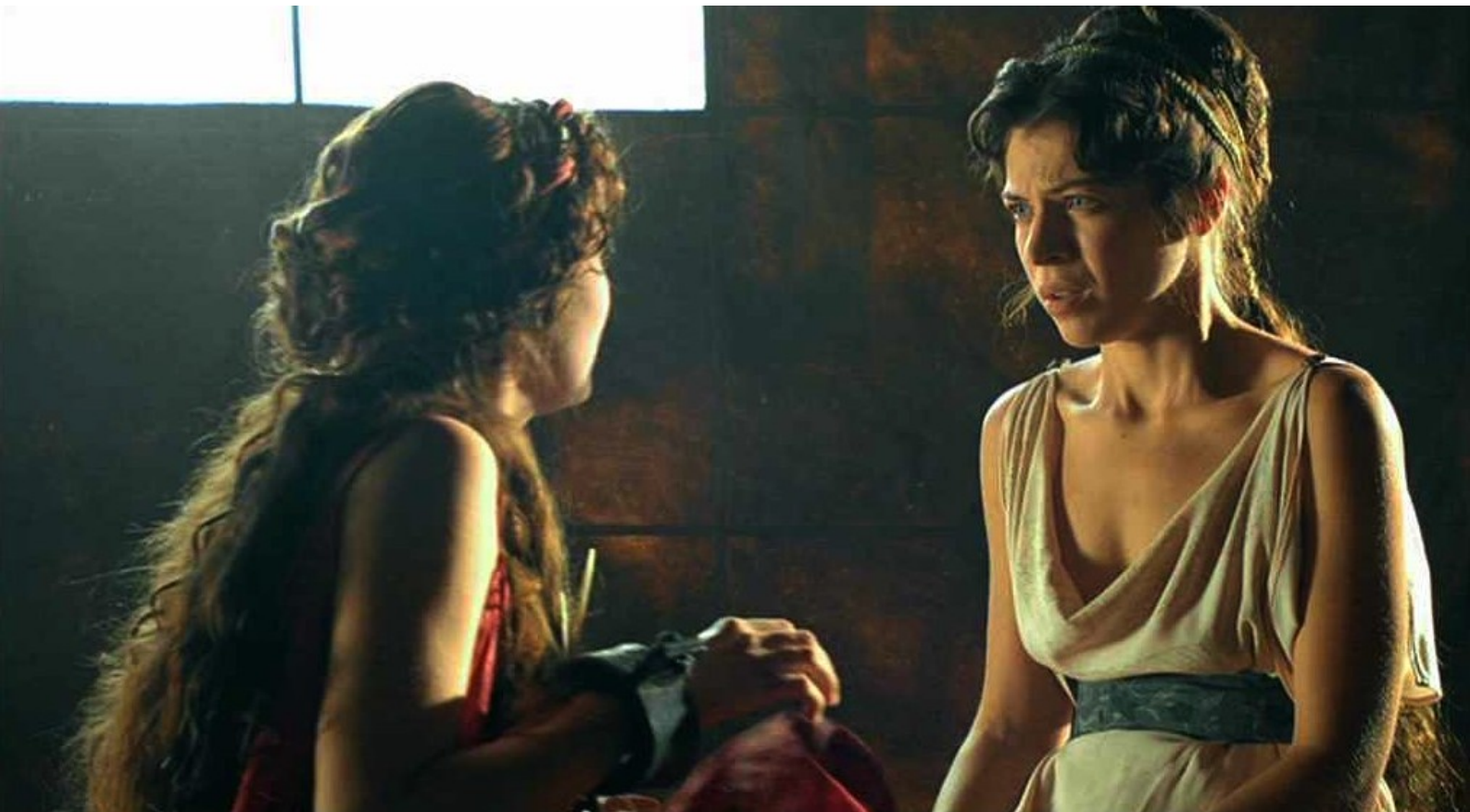
Hispania, la Leyenda : malgré les consolations de Gaia,