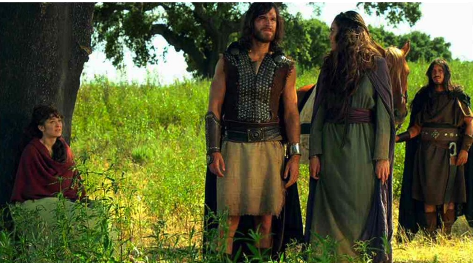
Hispania, la Leyenda : tandis que la vraie Claudia est encore prisonnière des Espagnols.