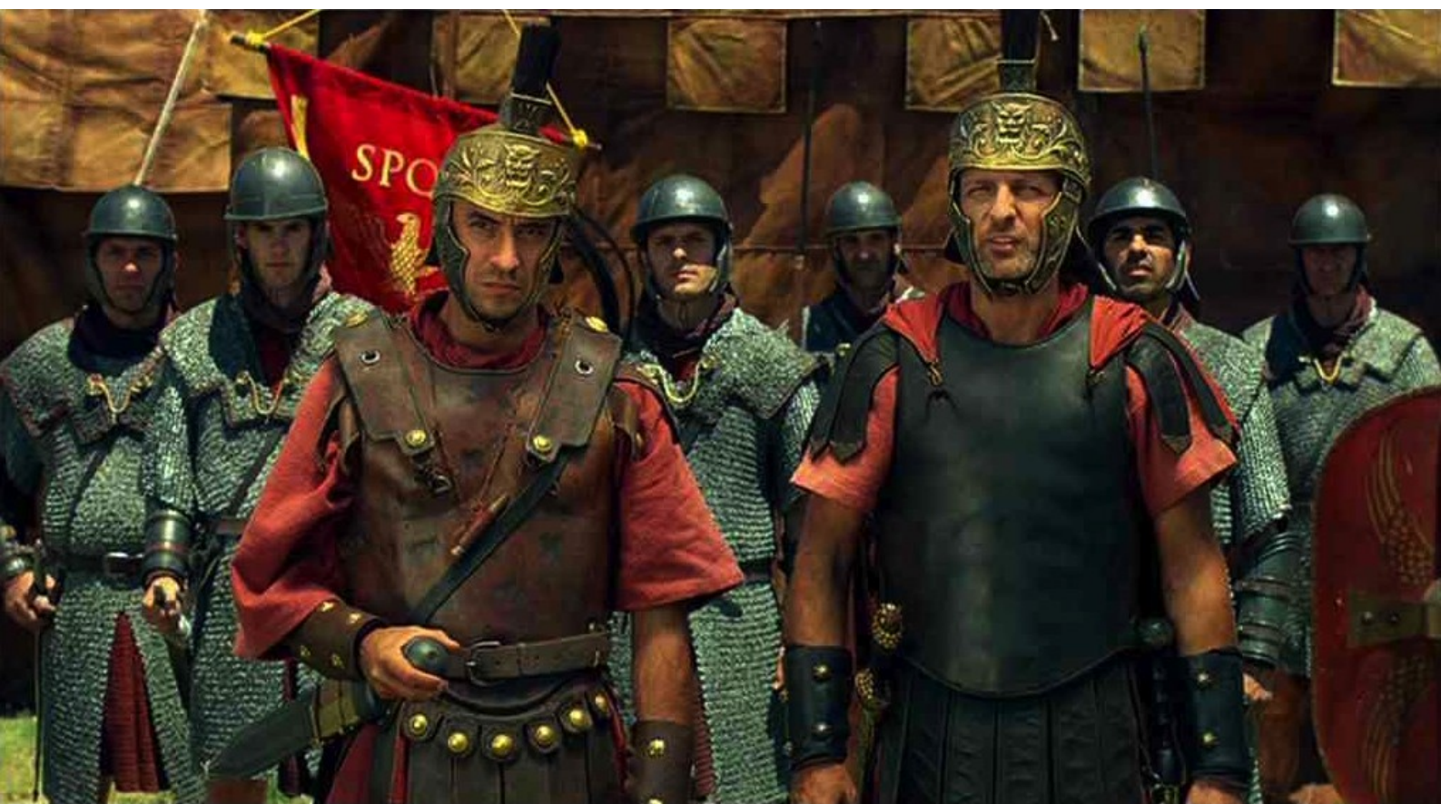
Hispania, la Leyenda : puis sont accueillis par Marco,