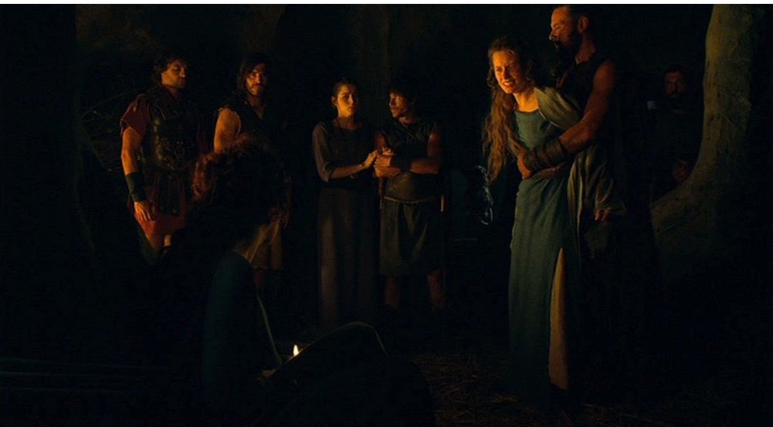
Hispania, la Leyenda : au grand désespoir d'Helena,