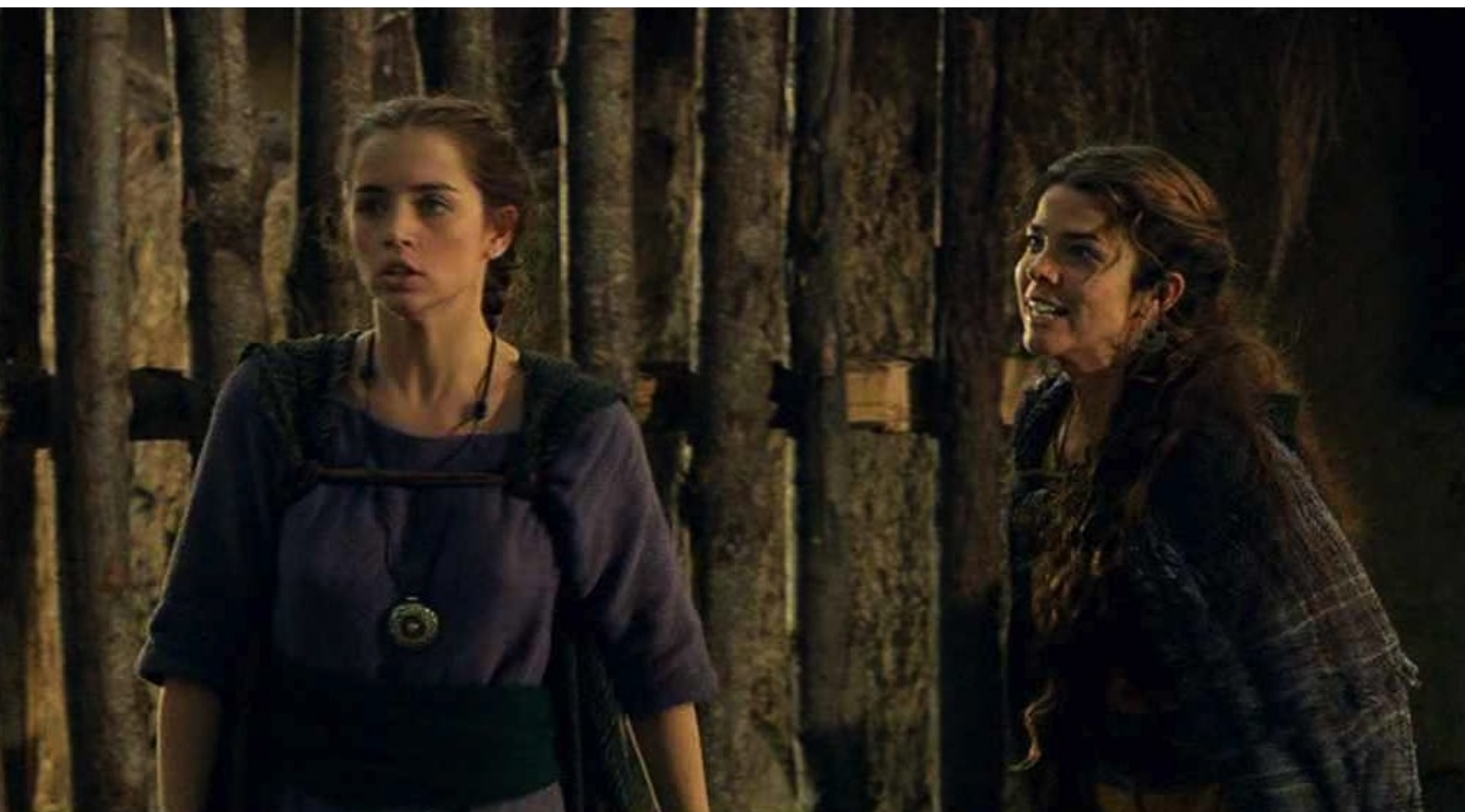
Hispania, la Leyenda : qui profite de son dos tourné pour l'assommer,