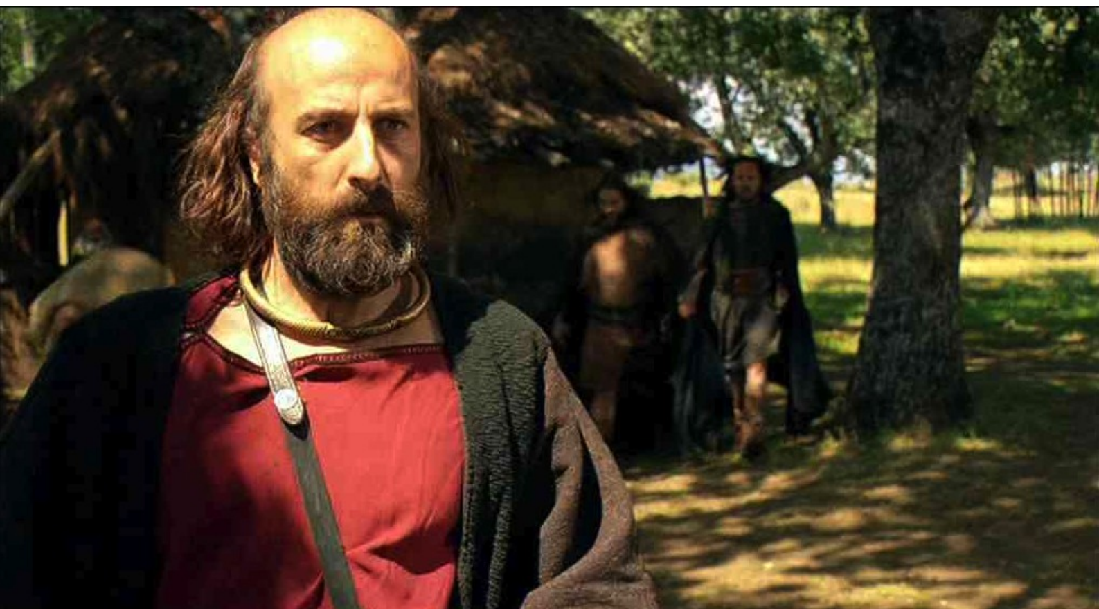
Hispania, la Leyenda : il a envie de revoir sa fille et son petit-fils ;