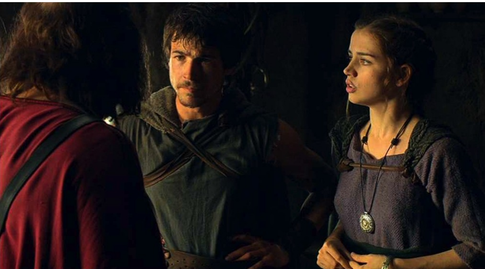
Hispania, la Leyenda : pour demander à Teodoro d'organiser avec les Romains un échange Claudia-Serbal.