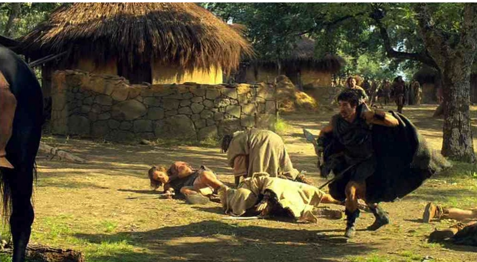
Hispania, la Leyenda : court vers un cheval...