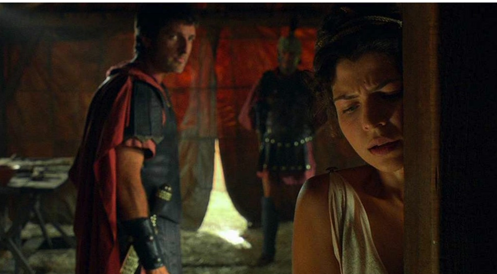
Hispania, la Leyenda : lorsque survient un homme qui annonce qu'on a trouvé le vrai coupable.