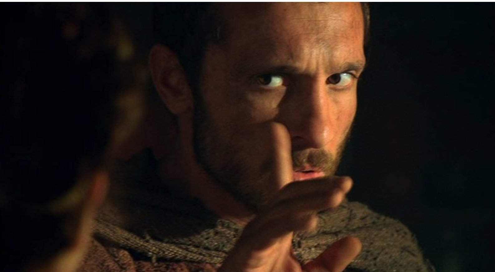
Hispania, la Leyenda : De retour au camp, Hector promet son aide...