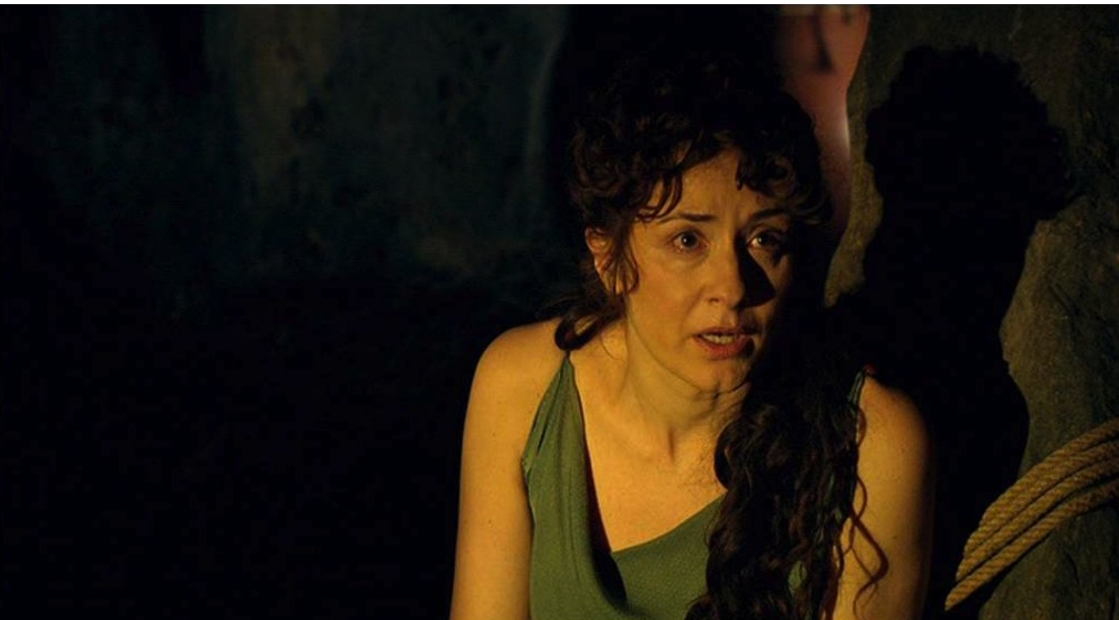
Hispania, la Leyenda : Au repaire, Claudia essaie maintenant de fléchir...