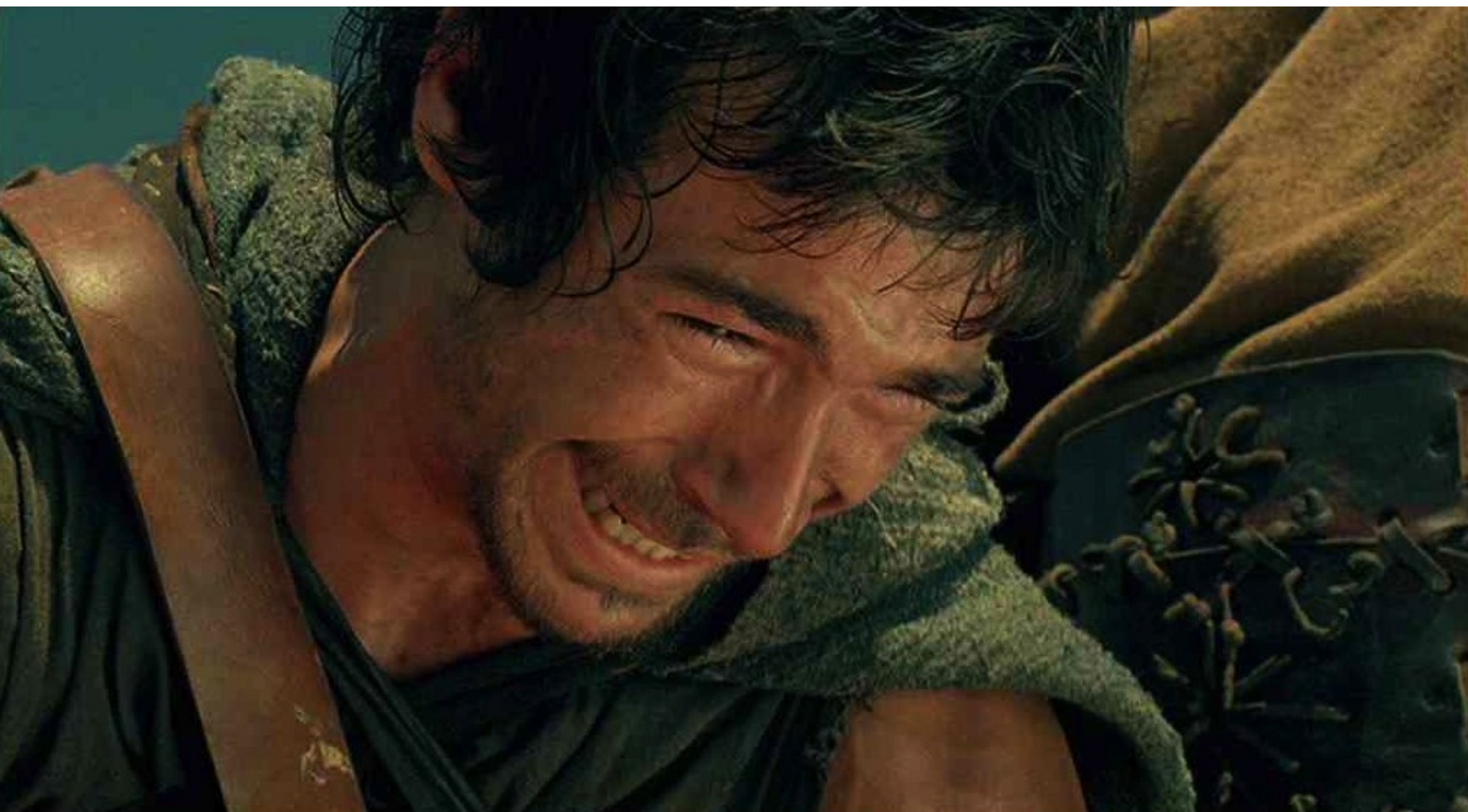
Hispania, la Leyenda : et la voit mourir dans ses bras,