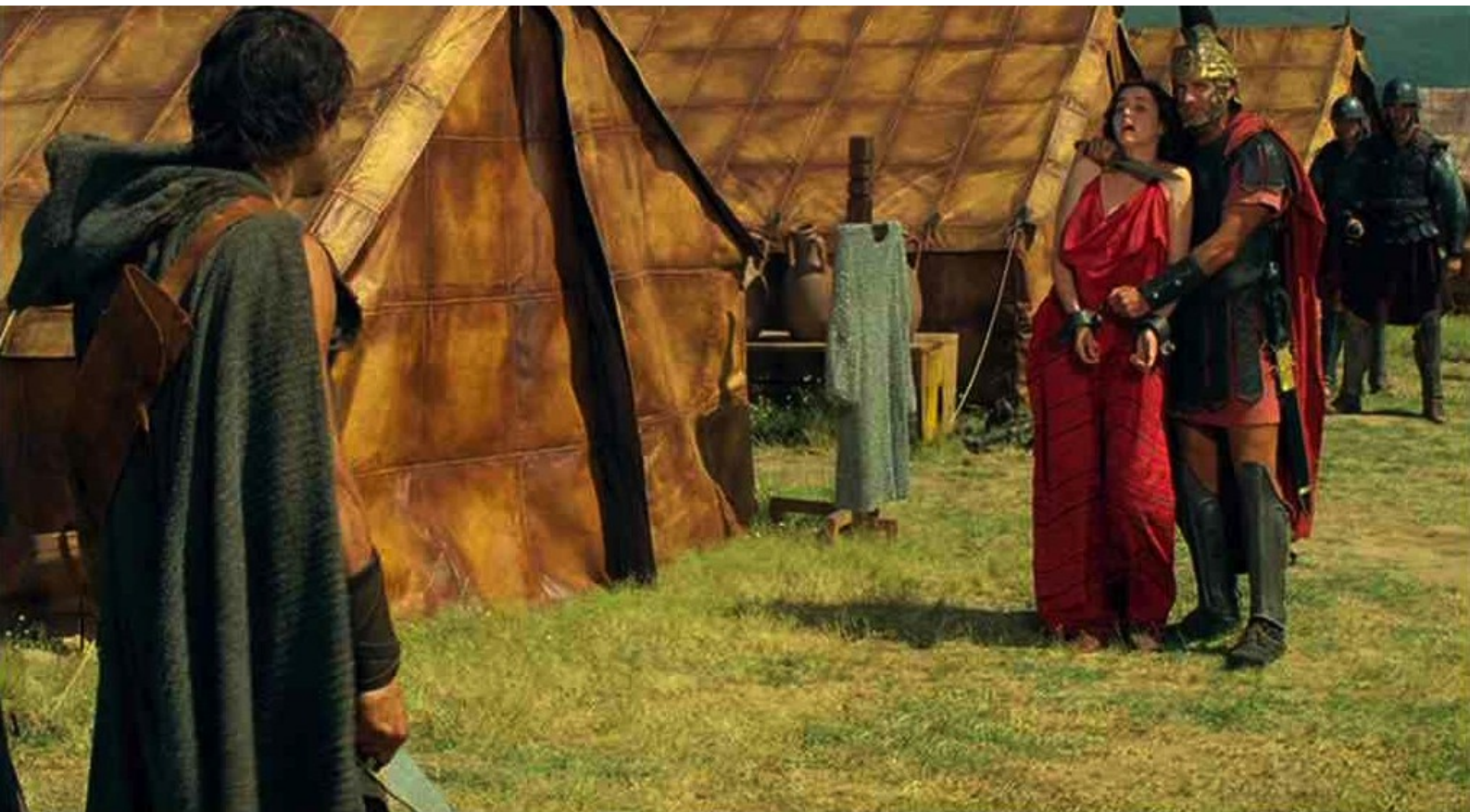
Hispania, la Leyenda : c'est Marco.