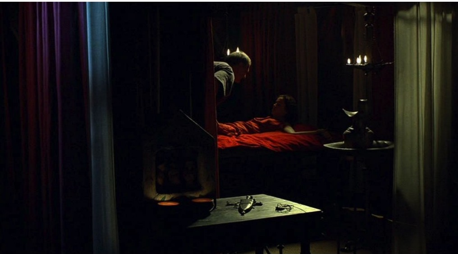
Hispania, la Leyenda : et finit par la violer malgré ses cris.