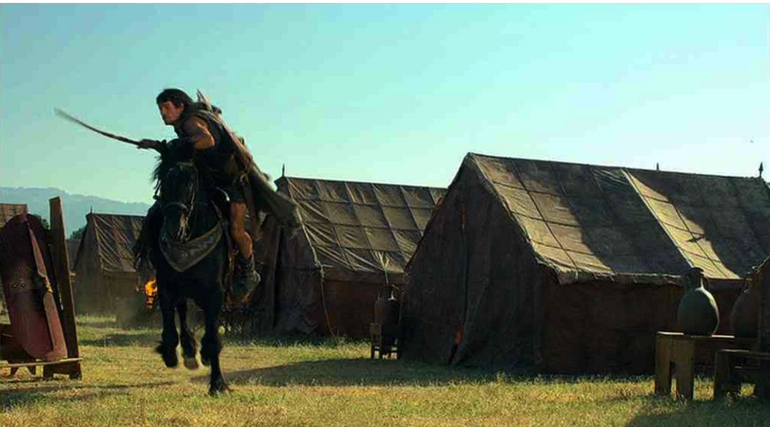
Hispania, la Leyenda : saute de sa monture...