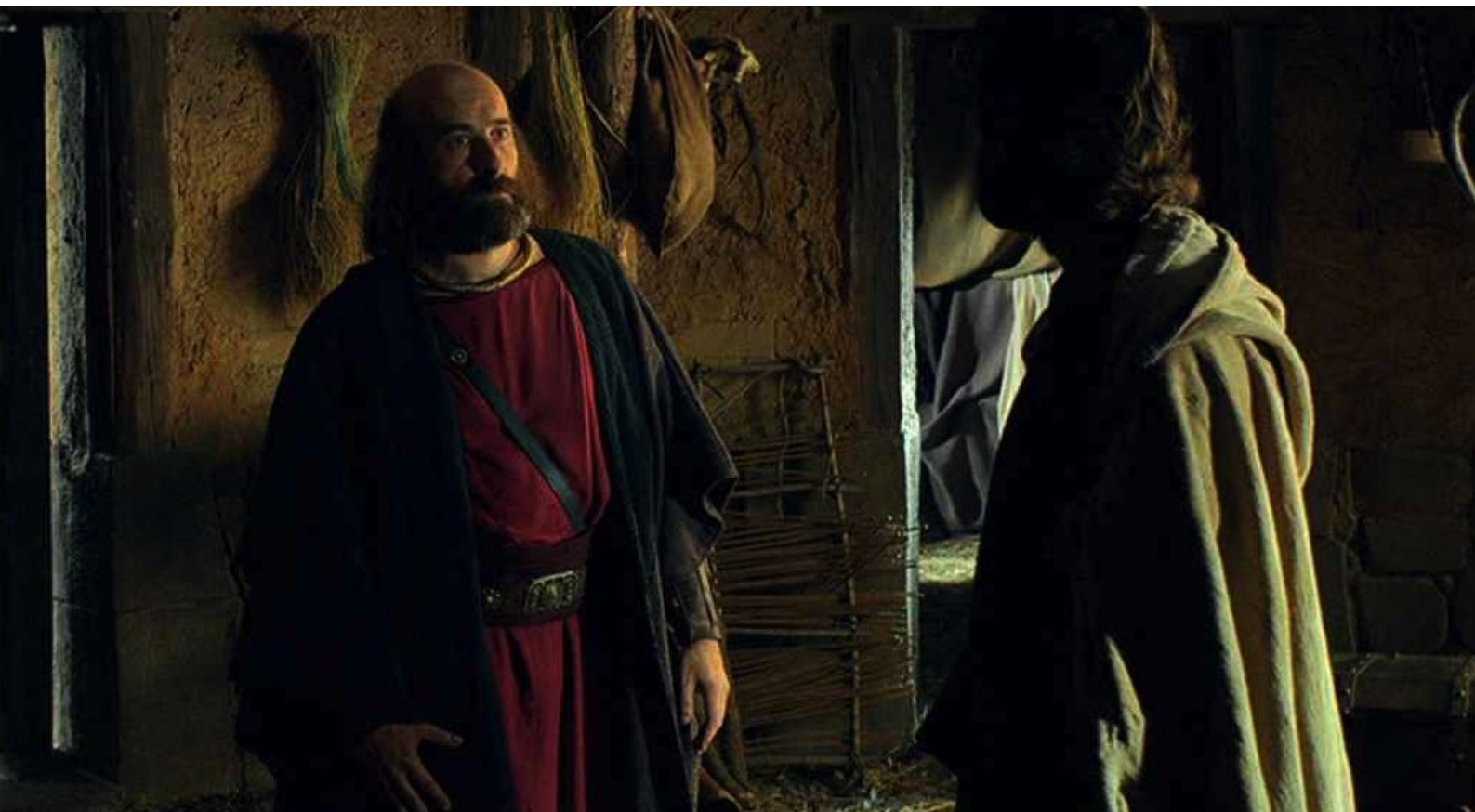
Hispania, la Leyenda : Après que Teodoro s'est disputé avec son beau-fils,