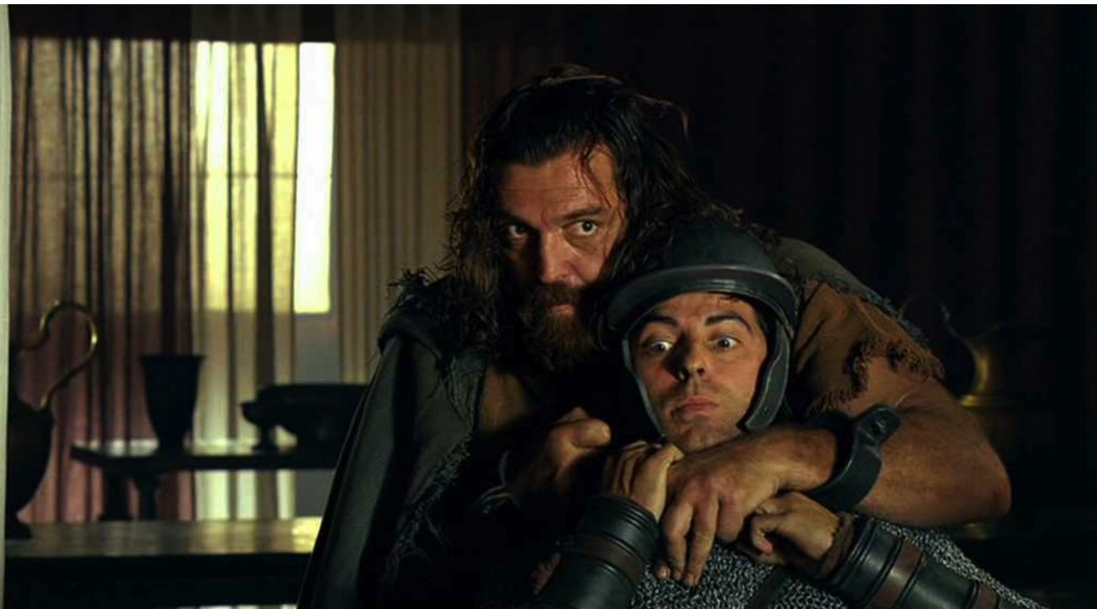
Hispania, la Leyenda : Sandro étrangle un soldat,