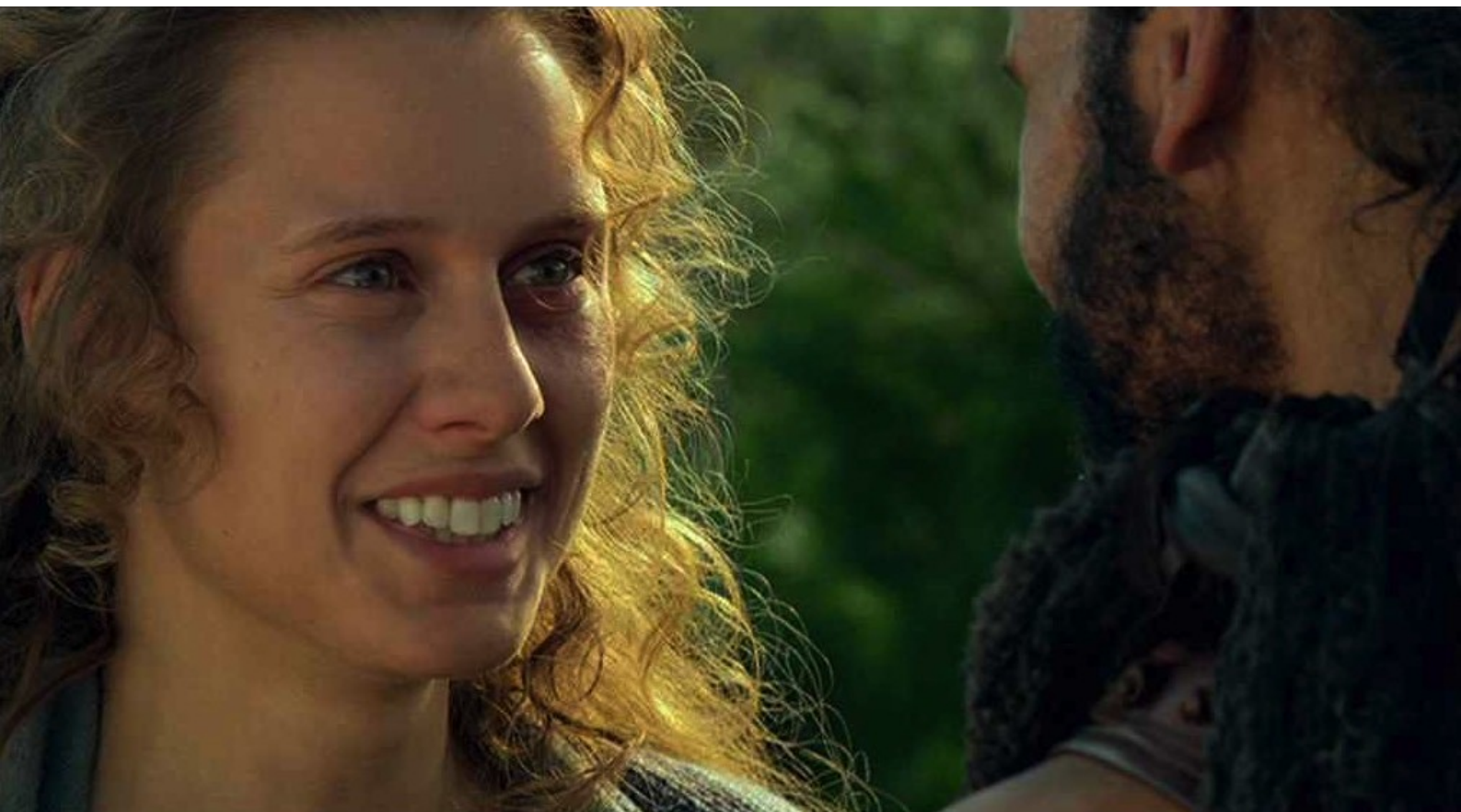
Hispania, la Leyenda : jusqu'à ce que Viriate lui rende le sourire en promettant de libérer le nourrisson.