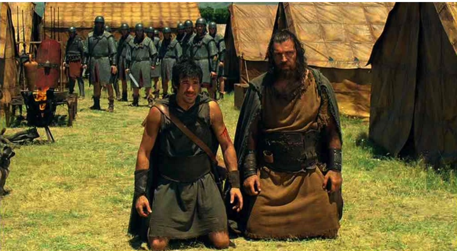
Hispania, la Leyenda : Alors, les deux Espagnols se jettent à genoux, suppliants.