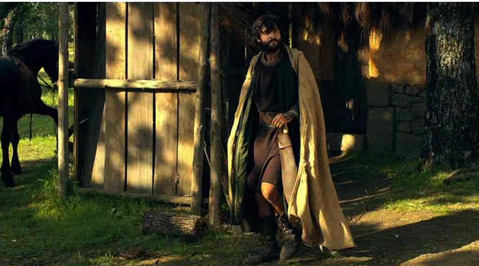
Hispania, la Leyenda : tandis qu'Alejo organise la traque.