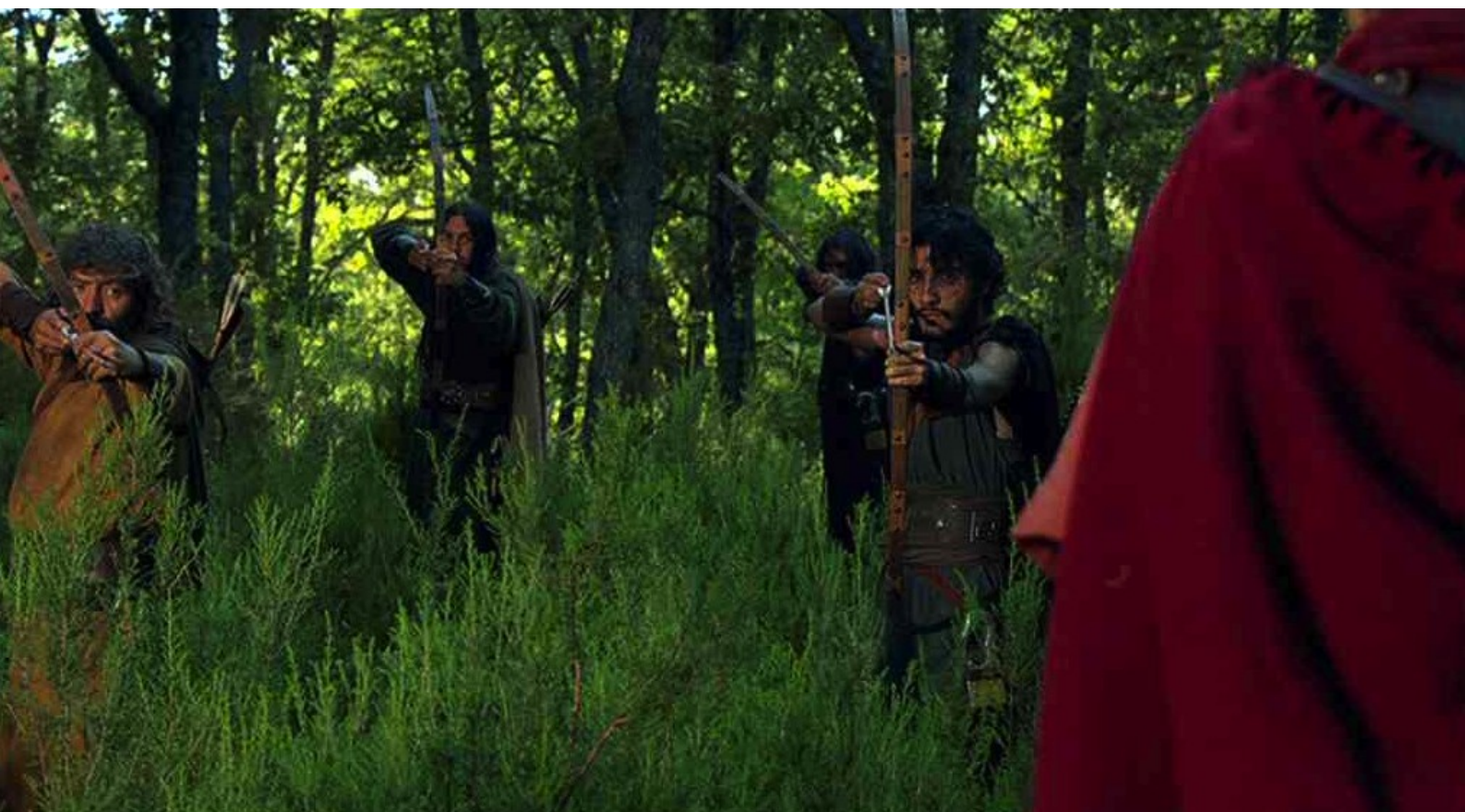
Hispania, la Leyenda : et il est arrêté par des rebelles ;