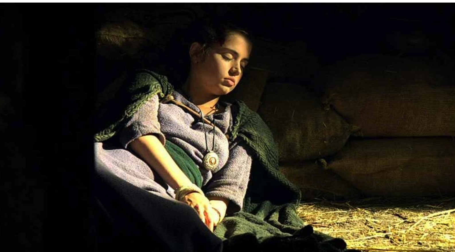
Hispania, la Leyenda : afin de la lui livrer pieds et poings liés.