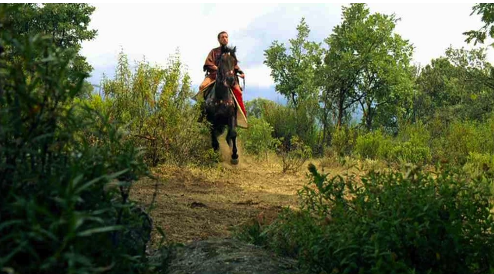
Hispania, la Leyenda : alors arrive Hector, qui annonce qu'elle est prisonnière des Romains.