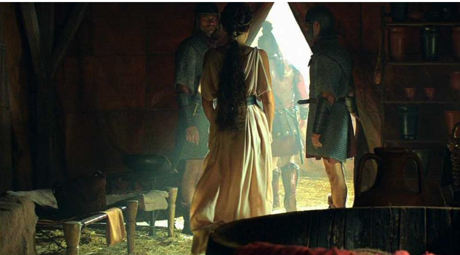
Hispania, la Leyenda : et, tandis qu'on l'emmène,