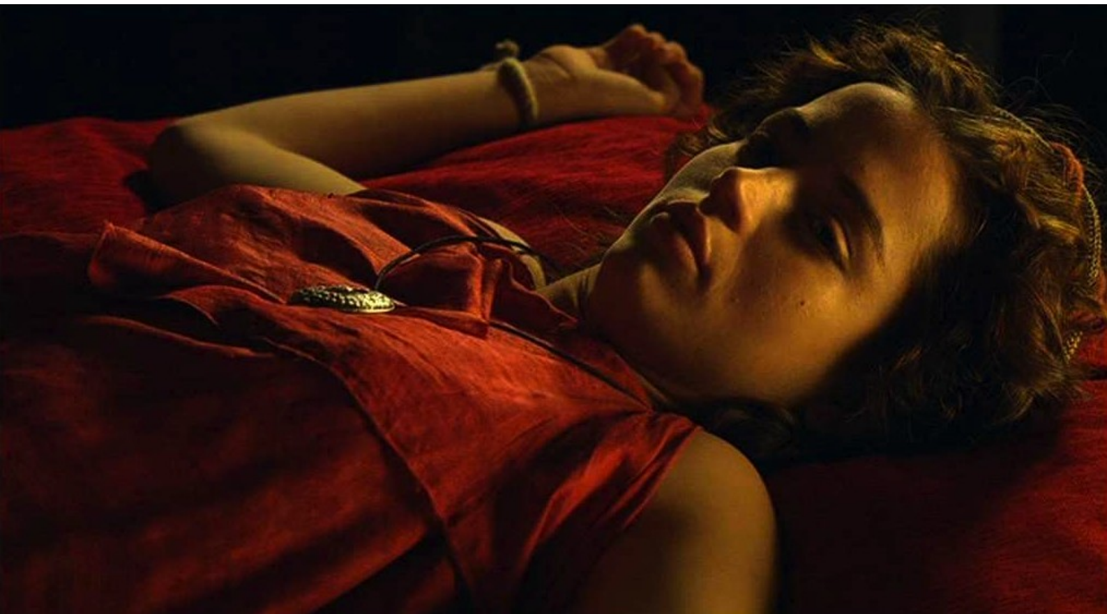
Hispania, la Leyenda : Elle revient à elle ligotée sur le lit du préteur,