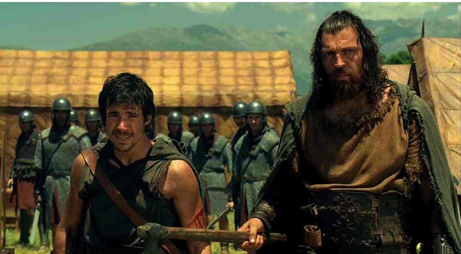
Hispania, la Leyenda : il dit "Nerea",