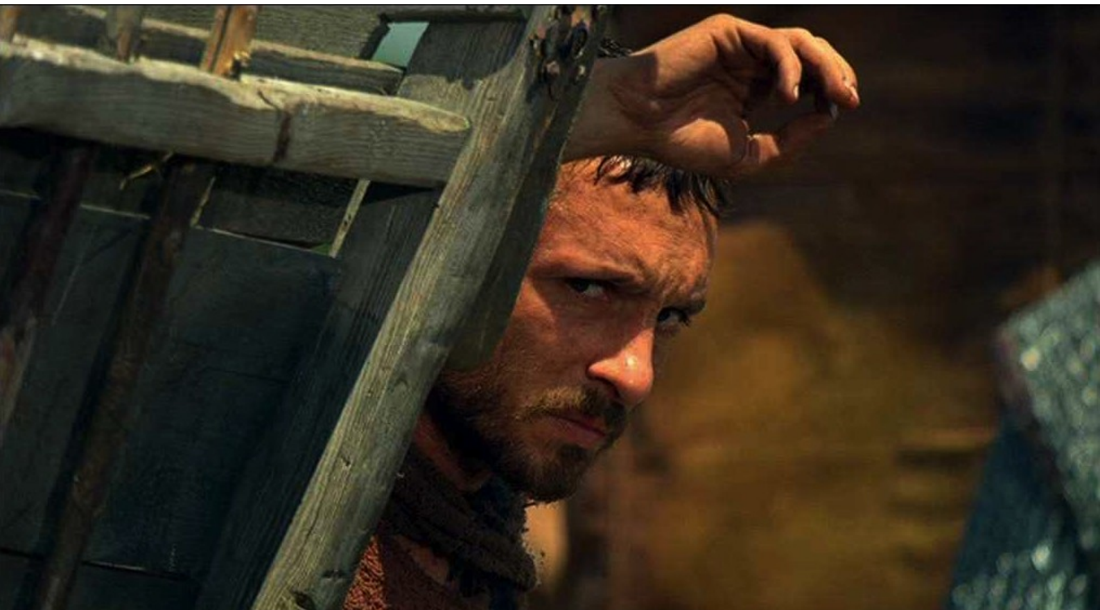
Hispania, la Leyenda : sous les yeux d'Hector, qui se dissimule.