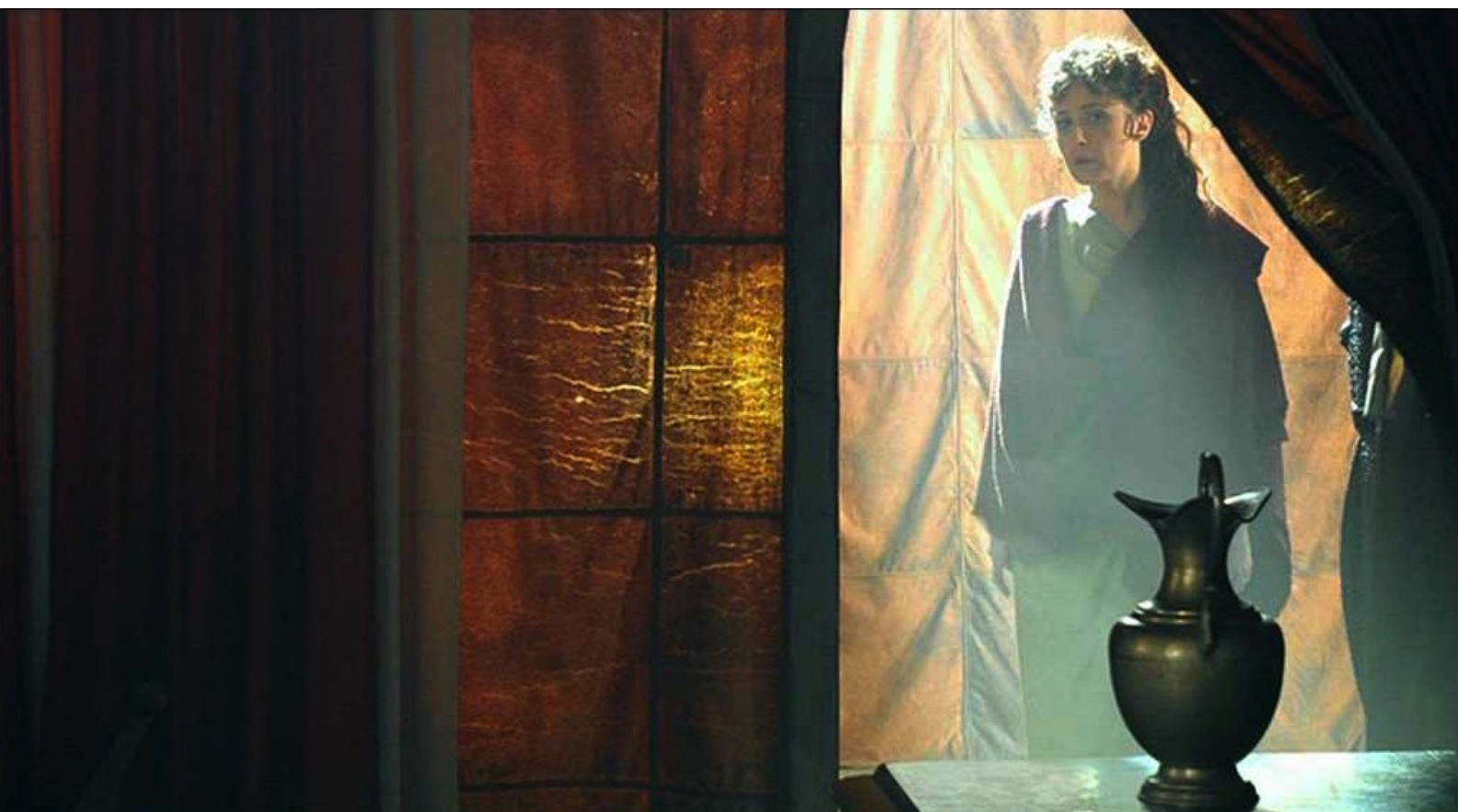
Hispania, la Leyenda : Quant à Claudia, elle est rentrée au camp,