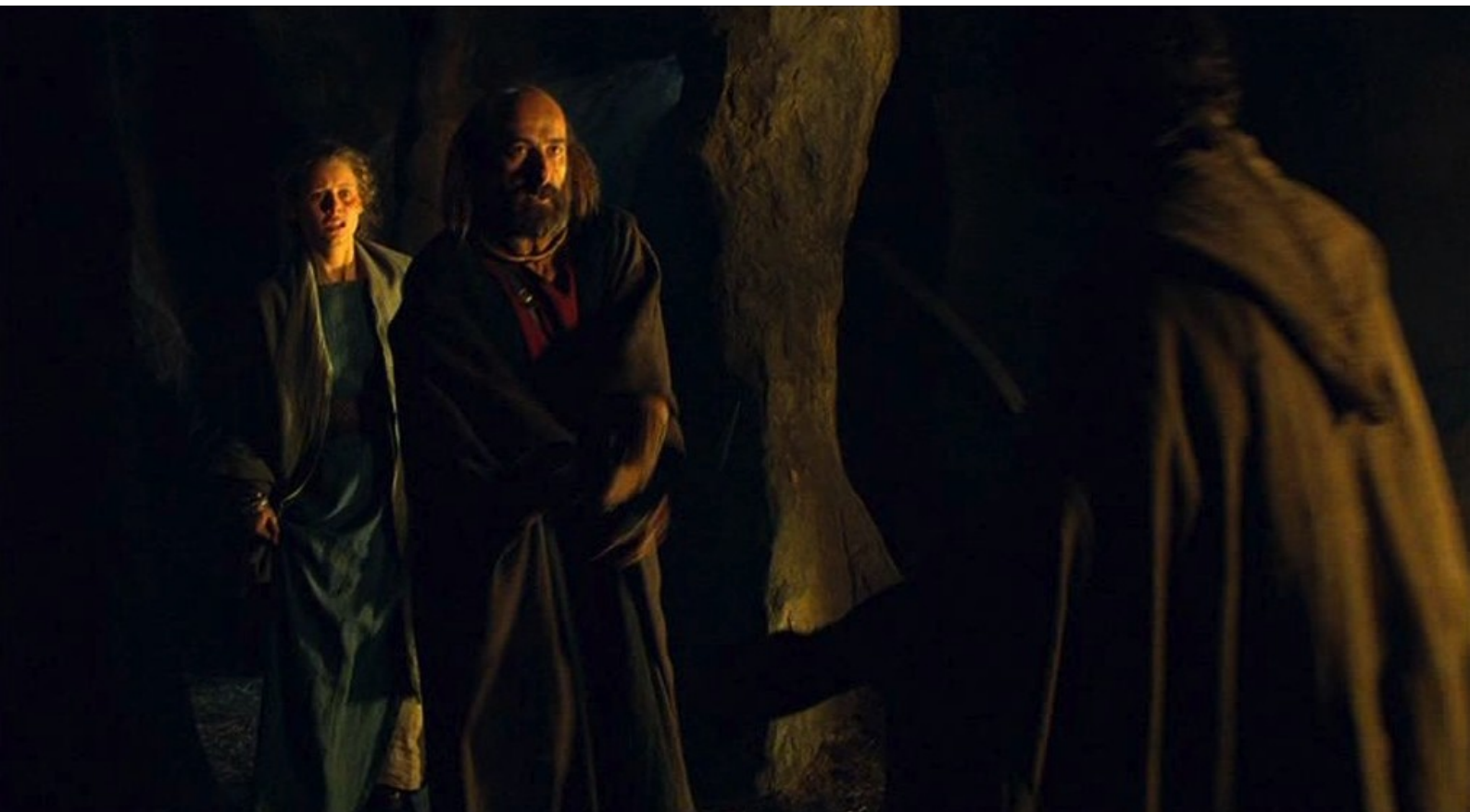
Hispania, la Leyenda : Ainsi, ce dernier surprend Helena et son père au repaire,