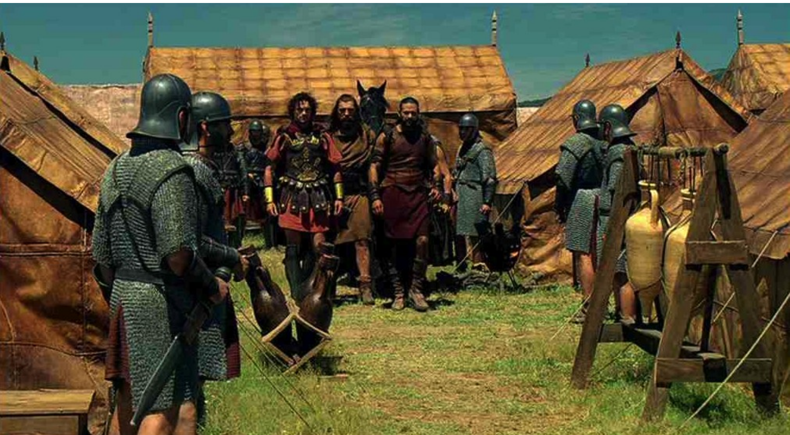
Hispania, la Leyenda : et s'avancent entre les tentes,