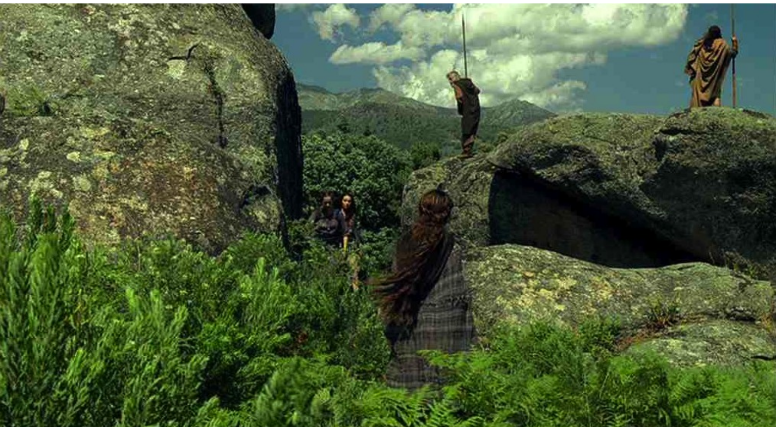
Hispania, la Leyenda : Aldara arrive au repaire et souhaite se faire admettre,

Comme portfolios du numéro 46 de La 12 e Heure , nous vous offrons plusieurs florilèges de photos tirées des épisodes de la série Hispania, la Leyenda , à laquelle nous avons consacré presque tout le numéro 46 de notre fanzine.