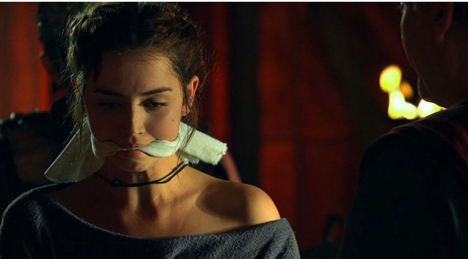
Hispania, la Leyenda : dûment bâillonnée, dans l'espoir d'obtenir le poste de chef de Caura.