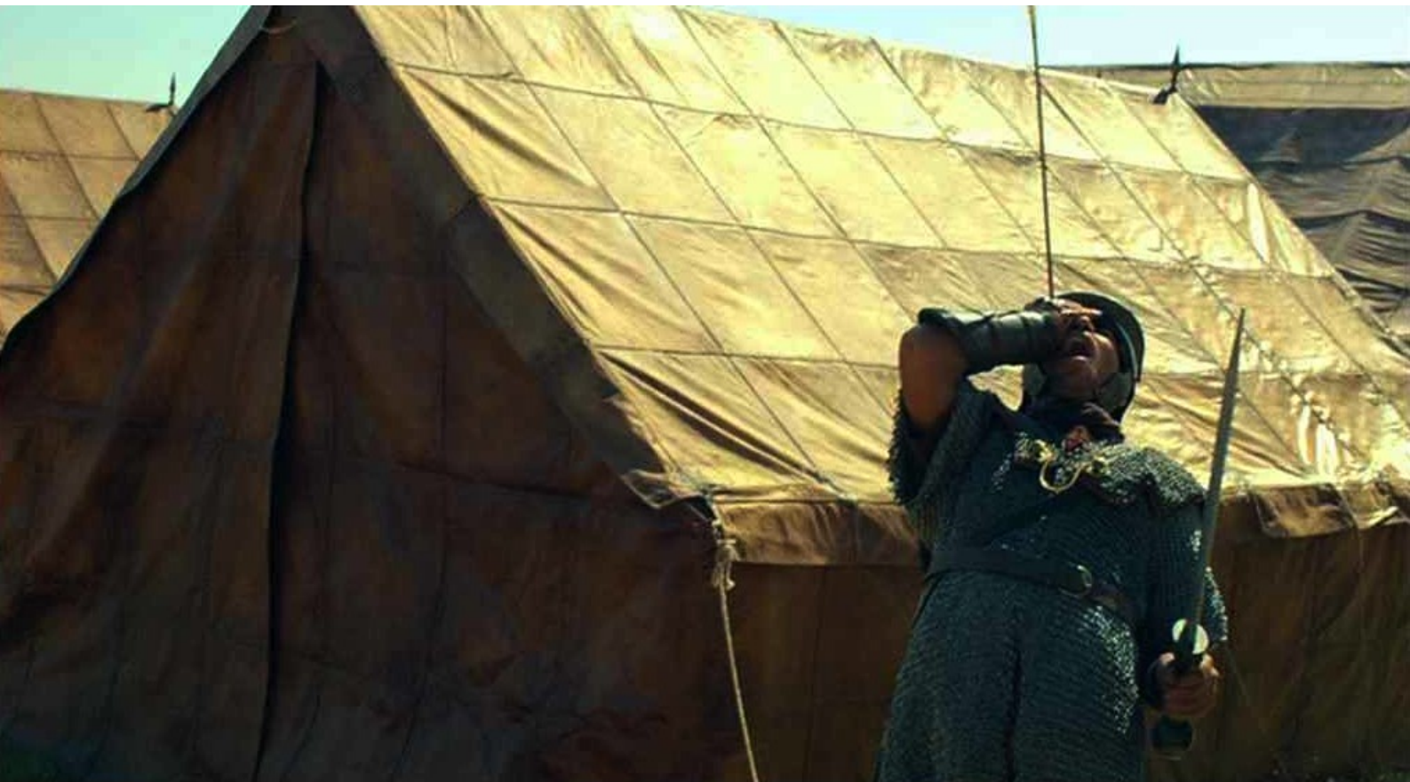
Hispania, la Leyenda : ils ont l'offensive et presque la victoire ;