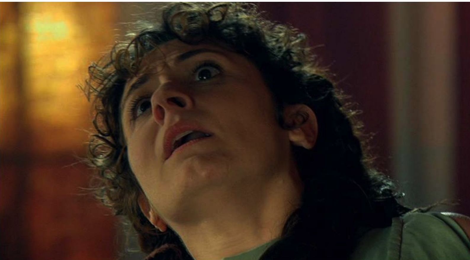
Hispania, la Leyenda : mais, terrorisée, elle invente un mensonge : elle serait enceinte de lui.