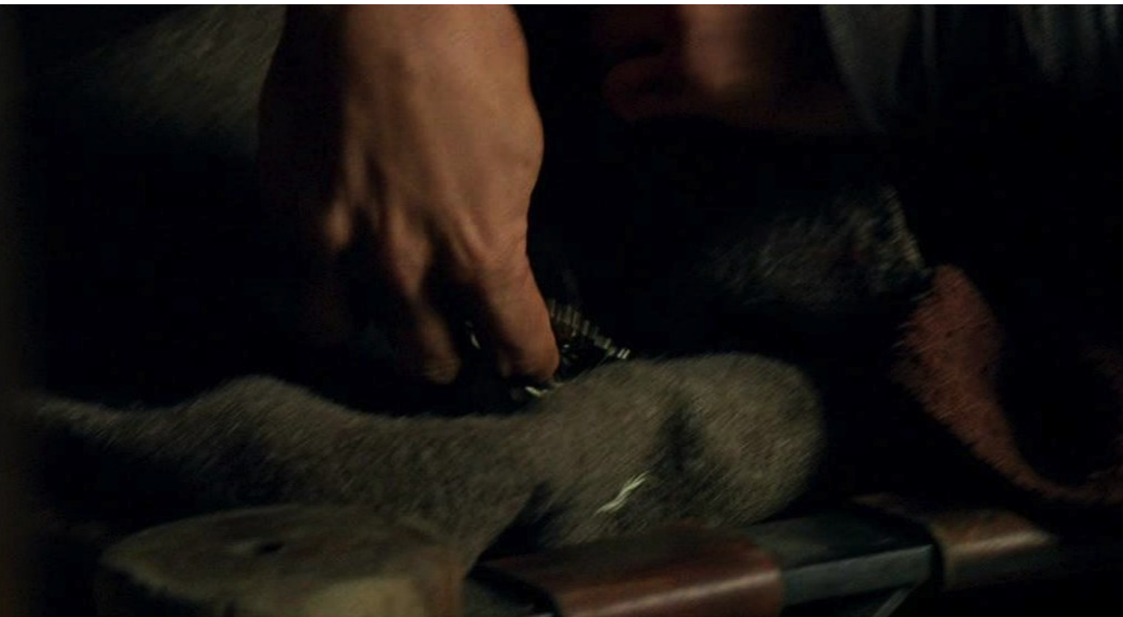
Hispania, la Leyenda : dans les effets personnels d'un légionnaire,