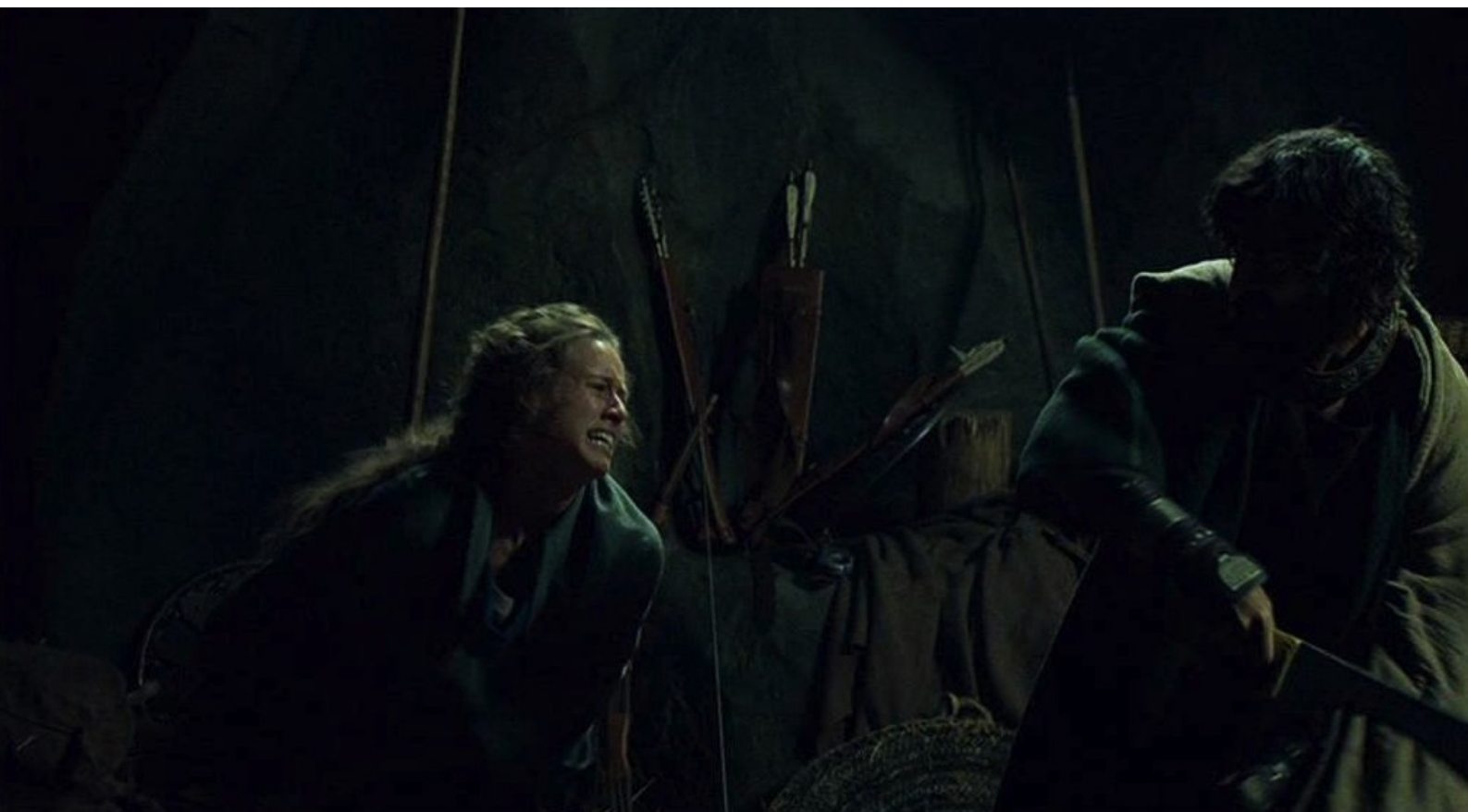
Hispania, la Leyenda : et enlève Helena malgré sa résistance.