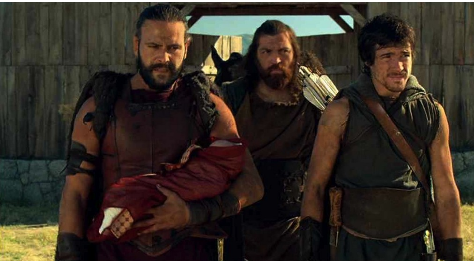
Hispania, la Leyenda : et en sort avec ses compagnons.