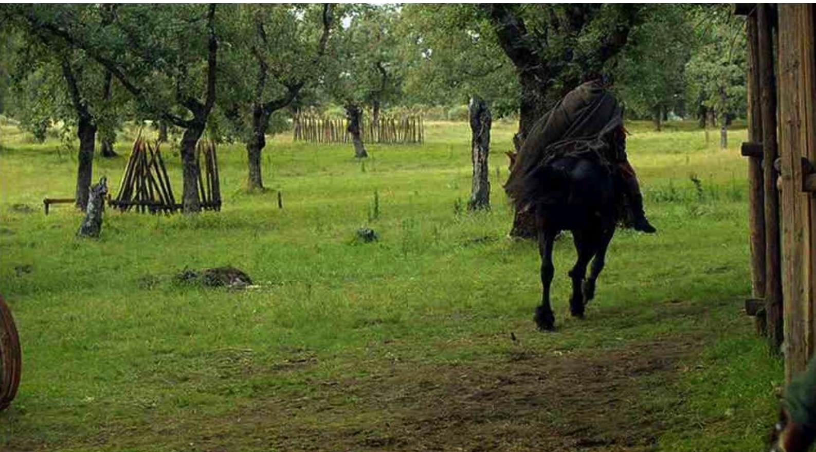
Hispania, la Leyenda : et s'enfuit au grand galop.