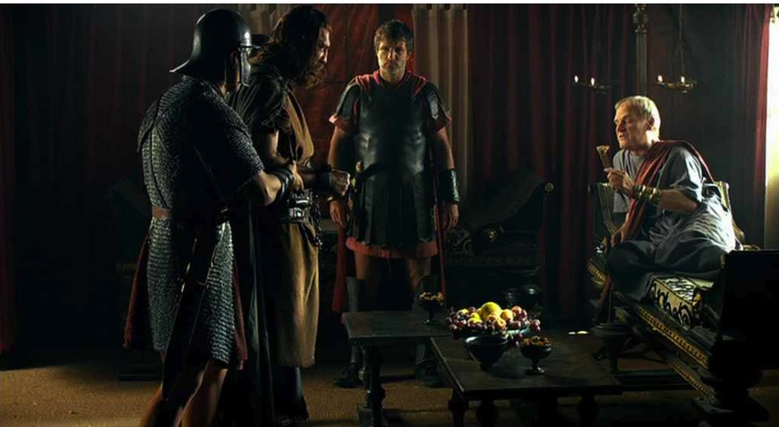
Hispania, la Leyenda : De son côté, humilié par Galba,