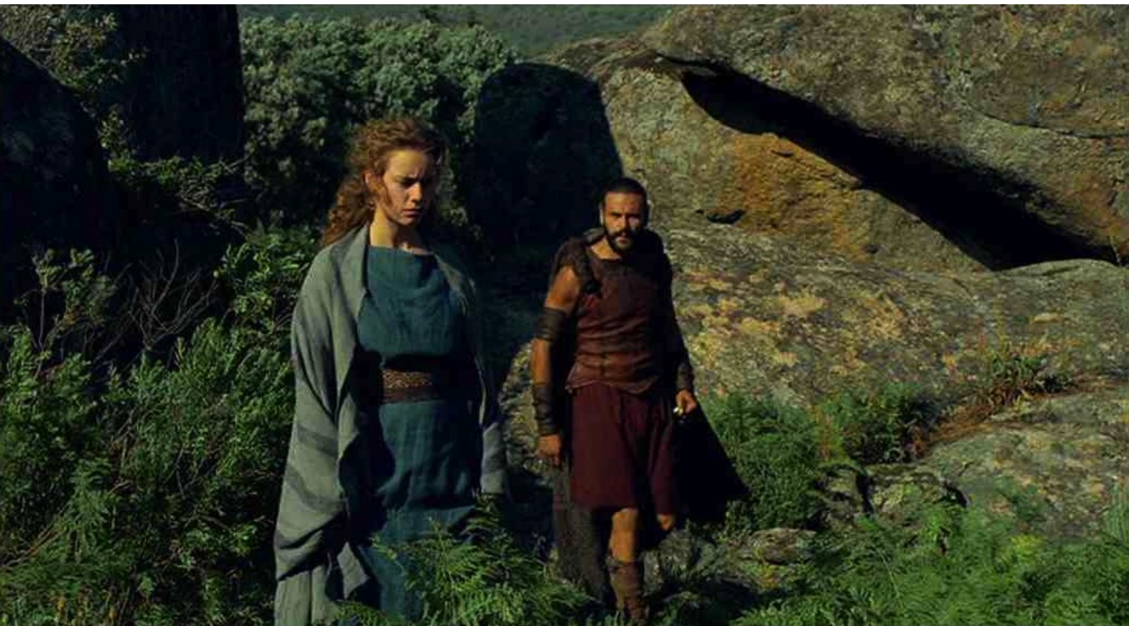
Hispania, la Leyenda : qui va pleurer devant la caverne,