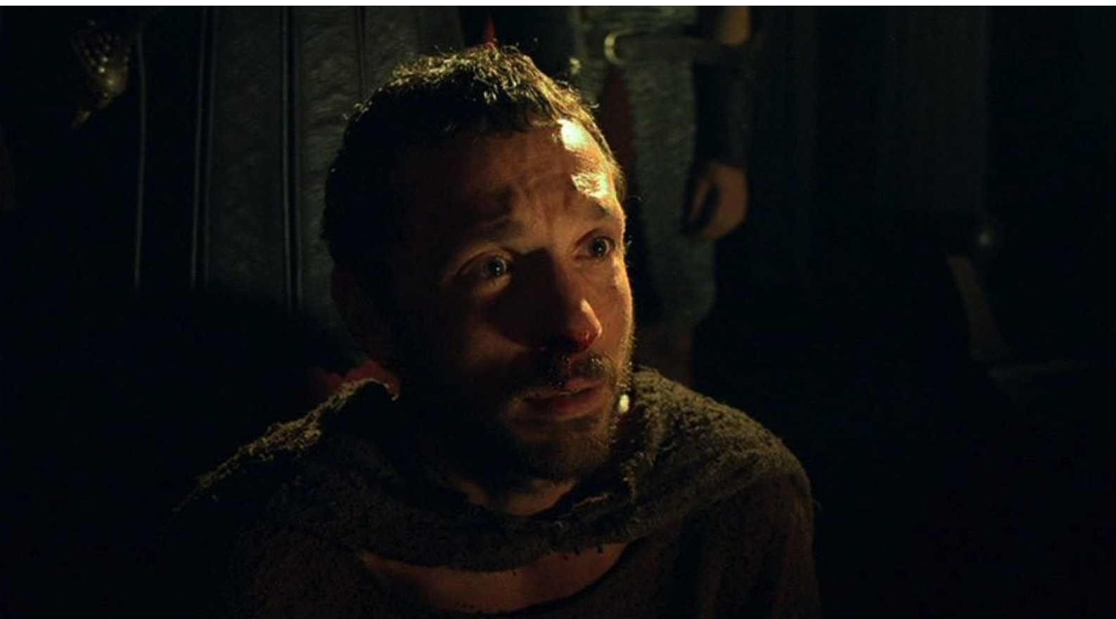
Hispania, la Leyenda : Hector avoue être le frère de Sandro et, pour sauver leurs deux vies,