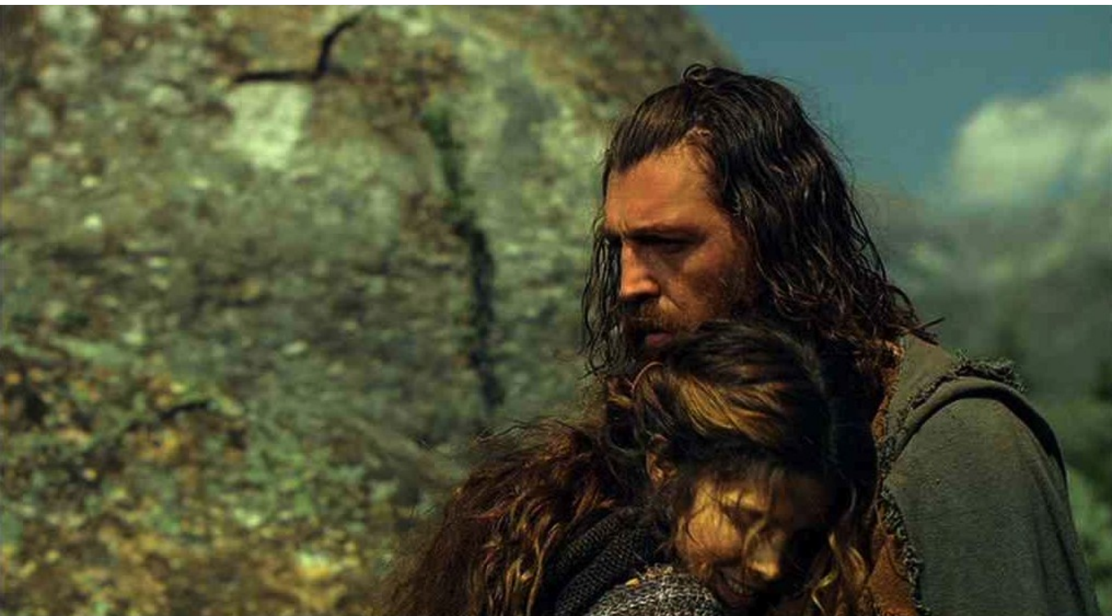
Hispania, la Leyenda : elle essaie de le séduire, mais en vain : elle est repoussée.