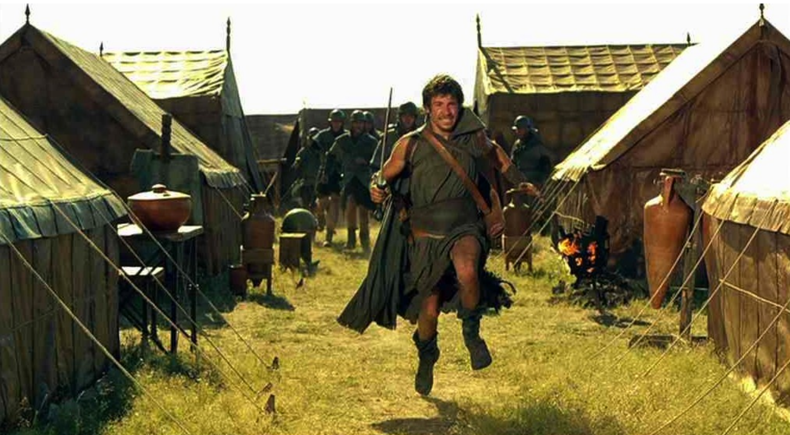
Hispania, la Leyenda : puis il s'enfuit,