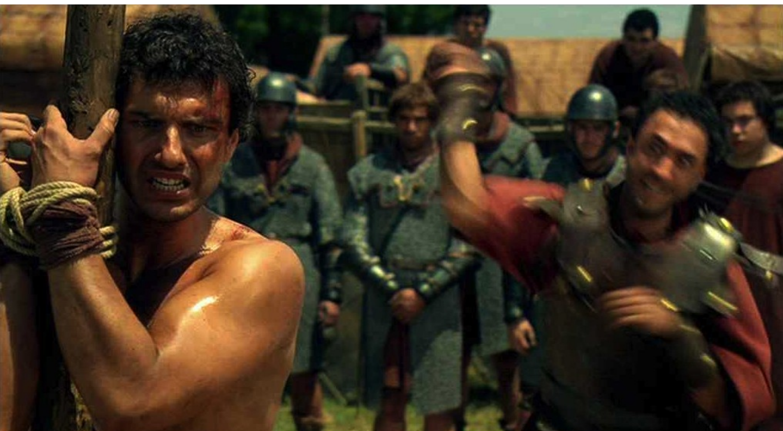
Hispania, la Leyenda : fait flageller le pseudo-coupable devant la troupe,