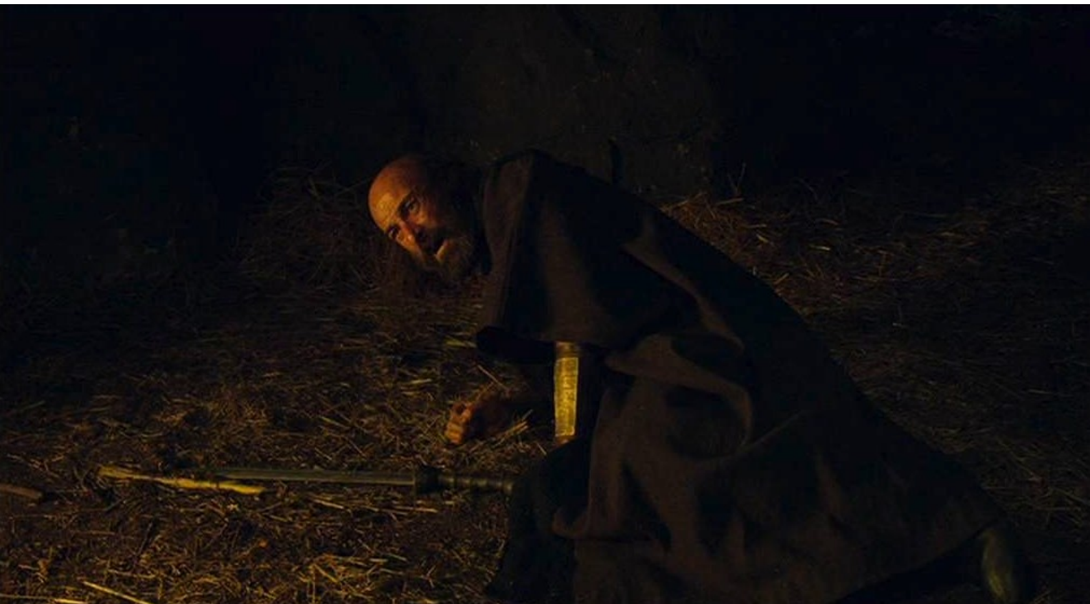
Hispania, la Leyenda : il blesse Teodoro...