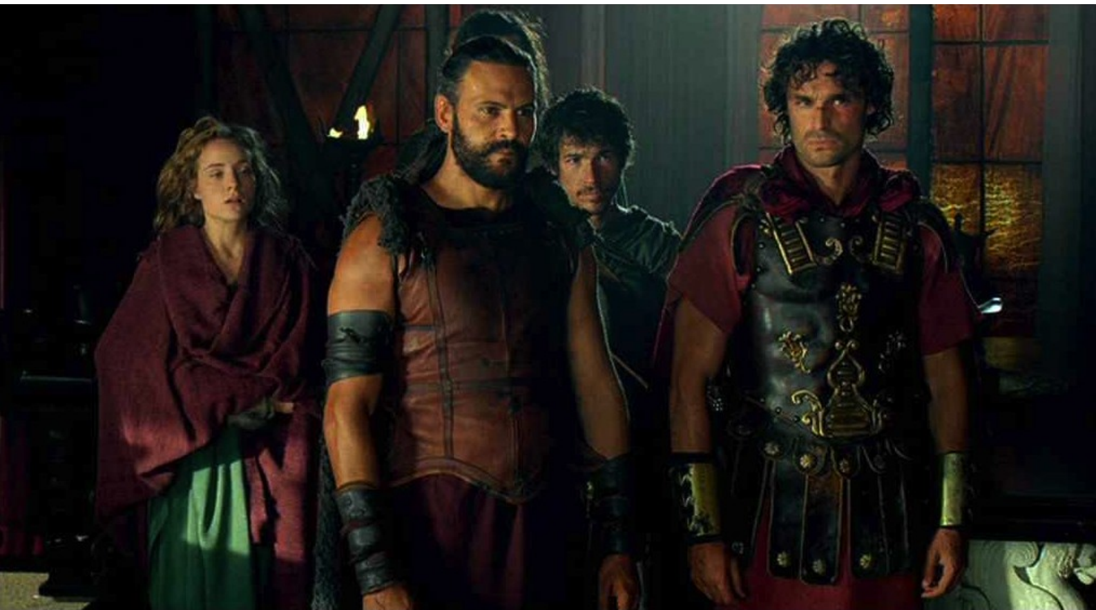
Hispania, la Leyenda : alors que les rebelles n'ont pas amené Claudia, mais Sabina déguisée,