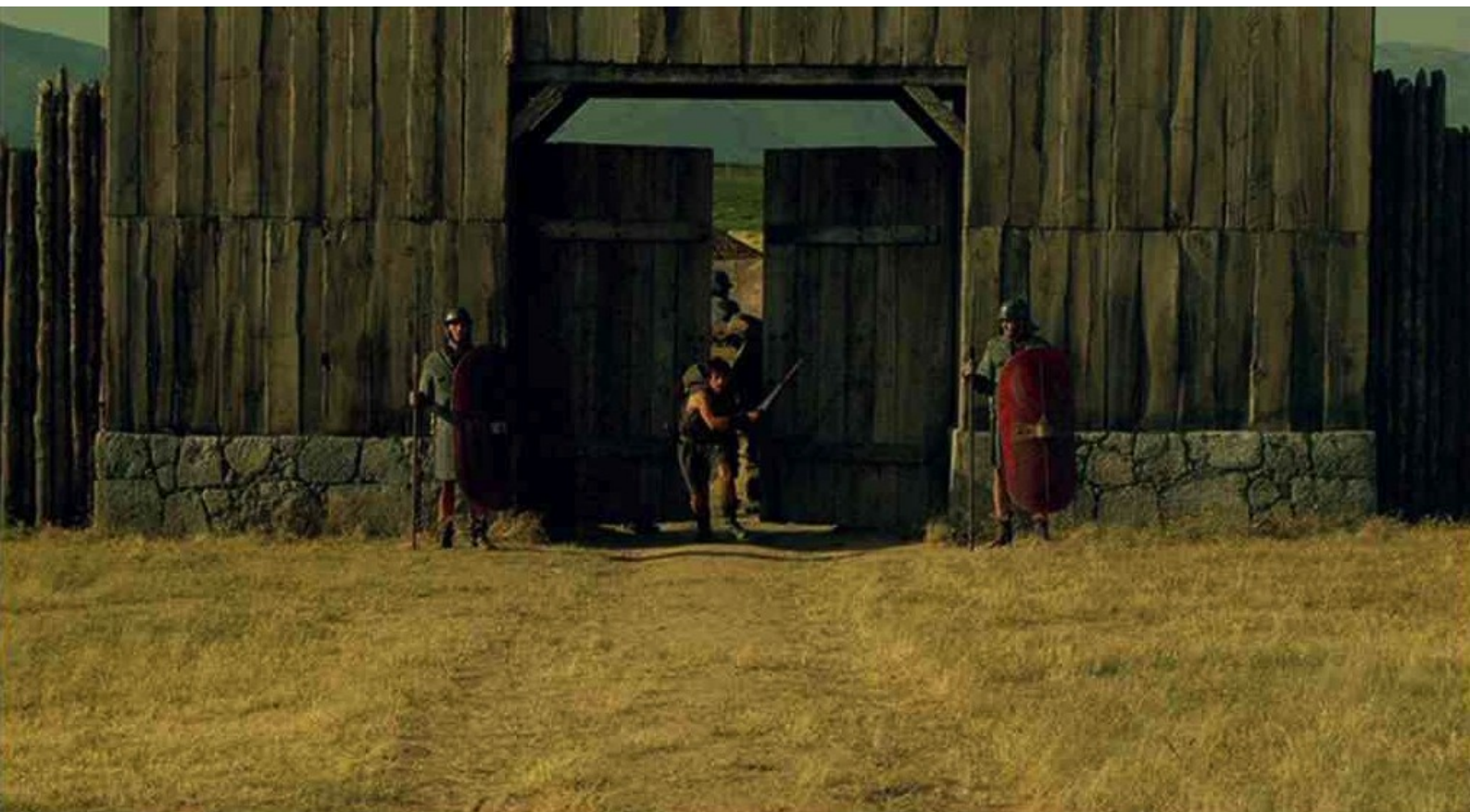
Hispania, la Leyenda : mais, quand il arrive dehors,