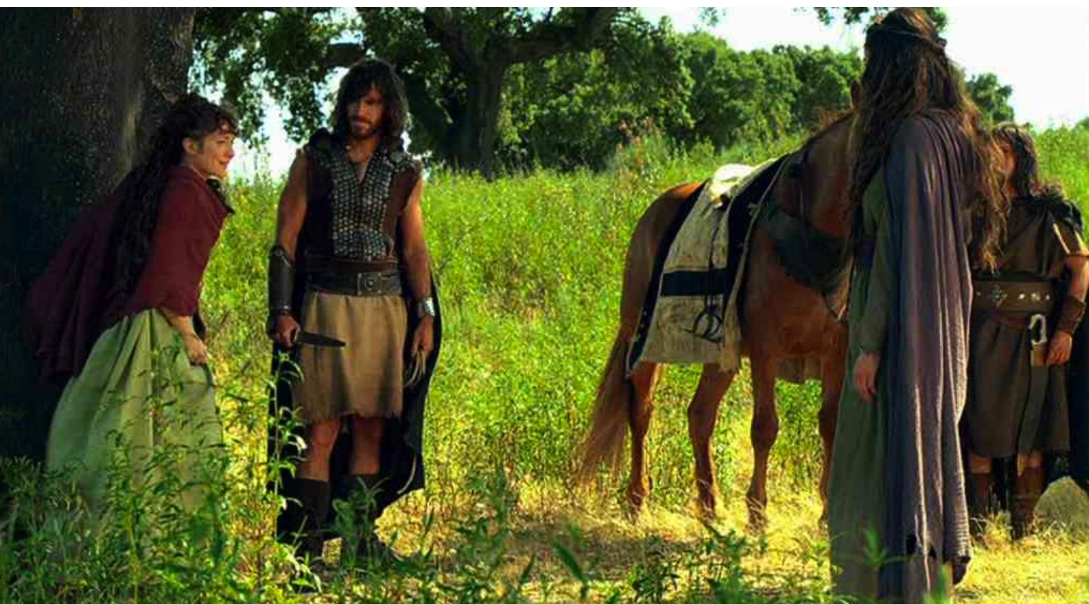
Hispania, la Leyenda : Claudia est détachée,