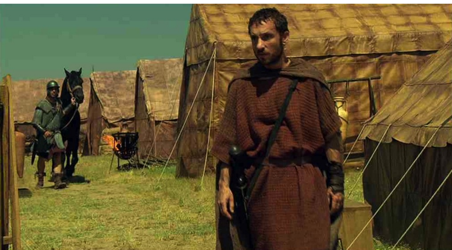
Hispania, la Leyenda : sous les yeux d'Hector,