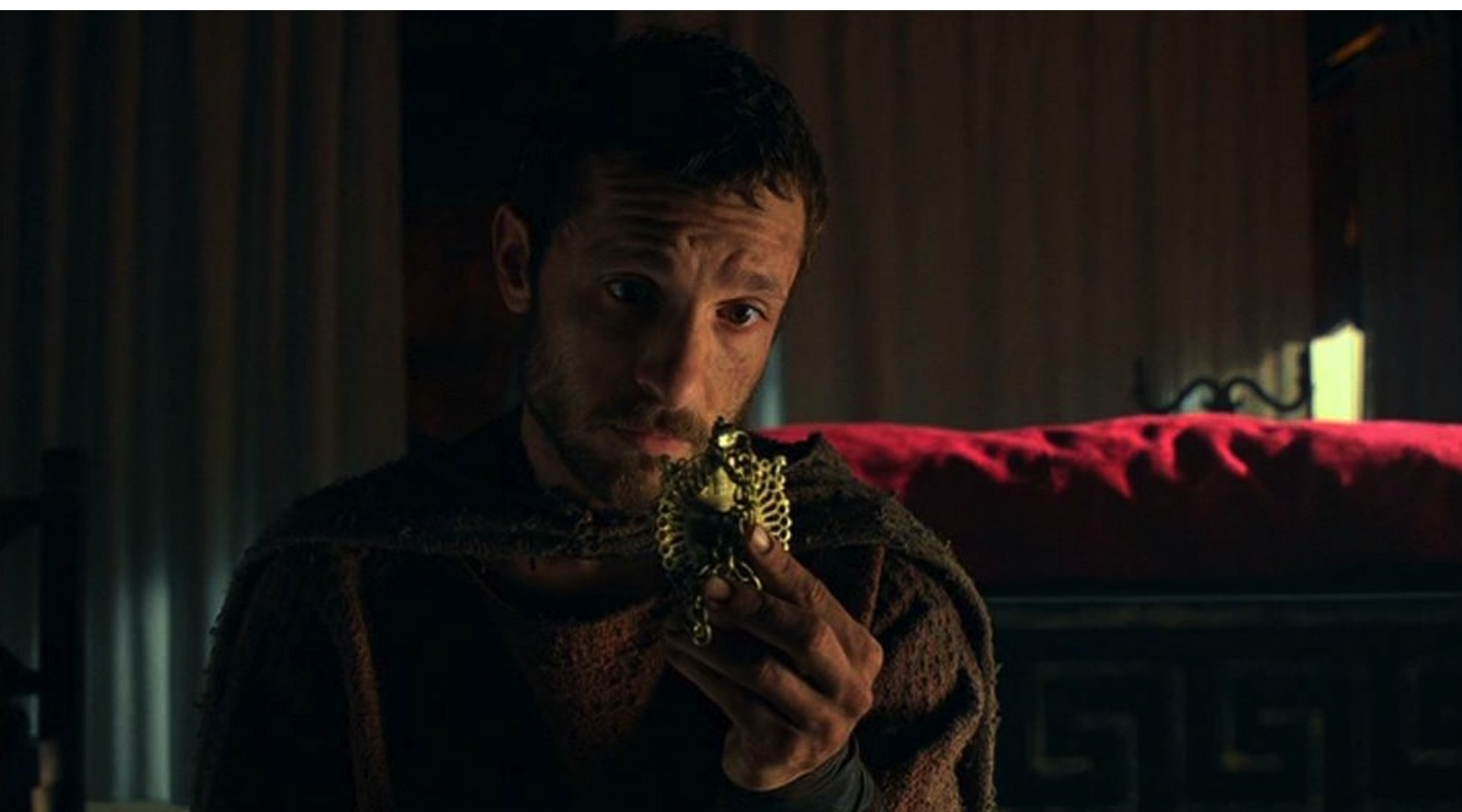
Hispania, la Leyenda : En fait, Hector avait caché un médaillon appartenant à Fabio...