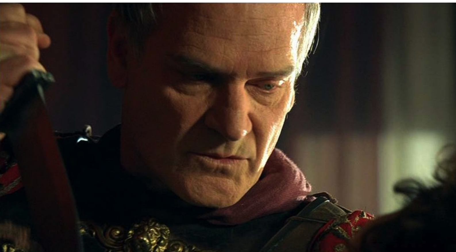
Hispania, la Leyenda : et veut la tuer,