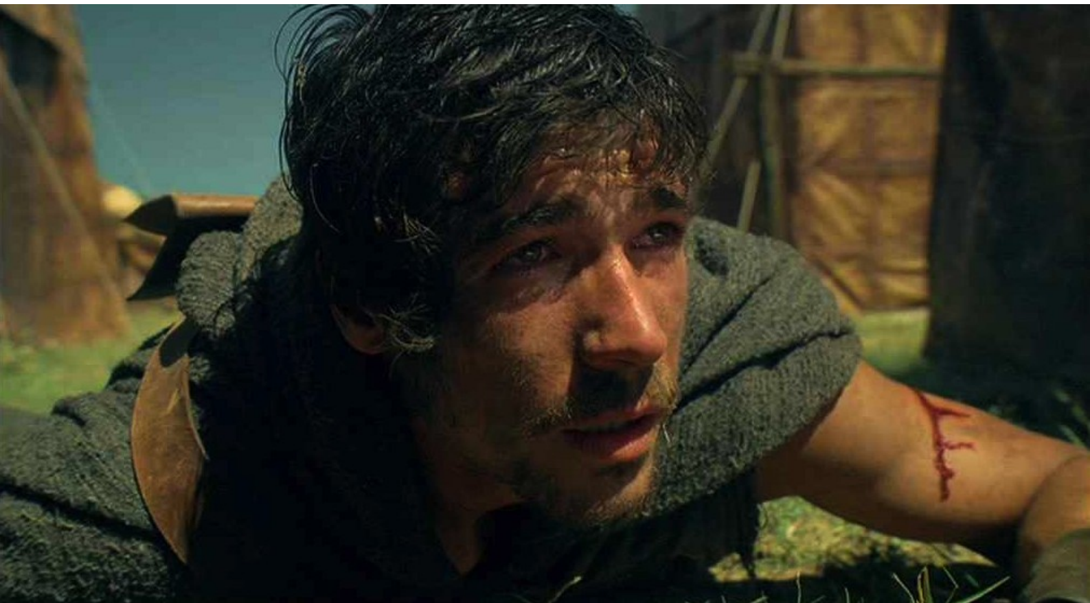
Hispania, la Leyenda : tombe et a une vision :