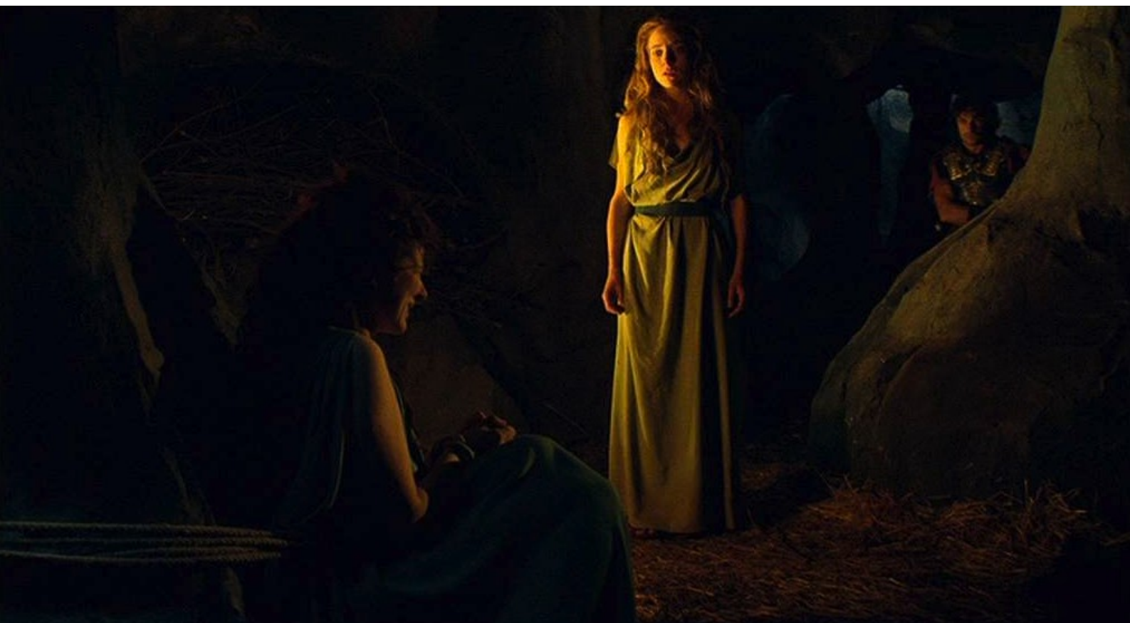
Hispania, la Leyenda : Sabina de la libérer, mais Fabio intervient à temps.