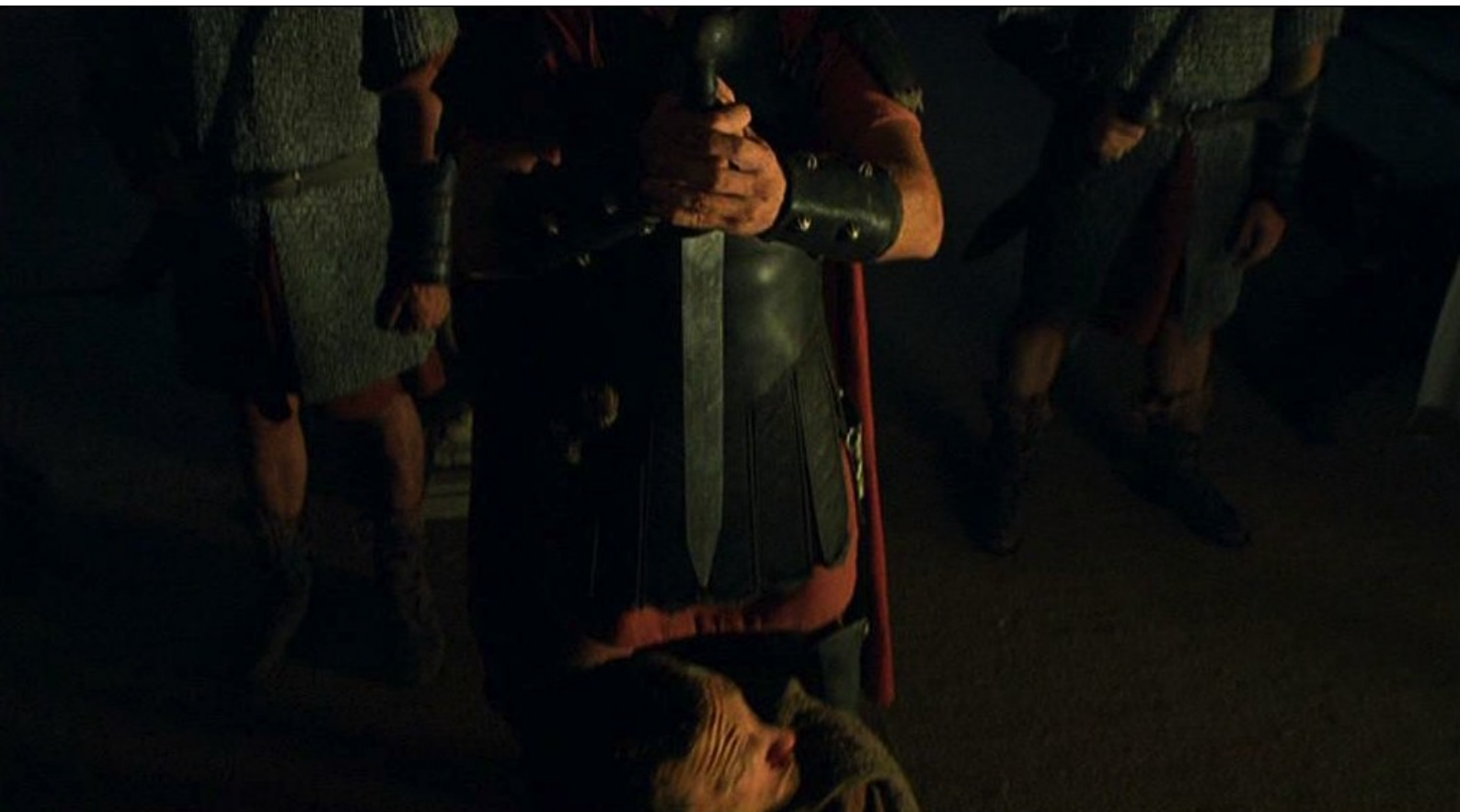
Hispania, la Leyenda : frappé et menacé d'être exécuté,