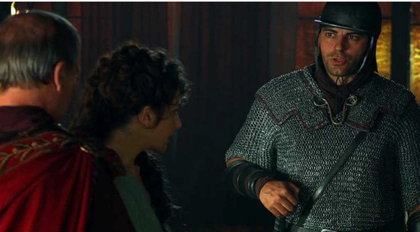
Hispania, la Leyenda : mais un soldat apporte à Galba une lettre de Fabio,