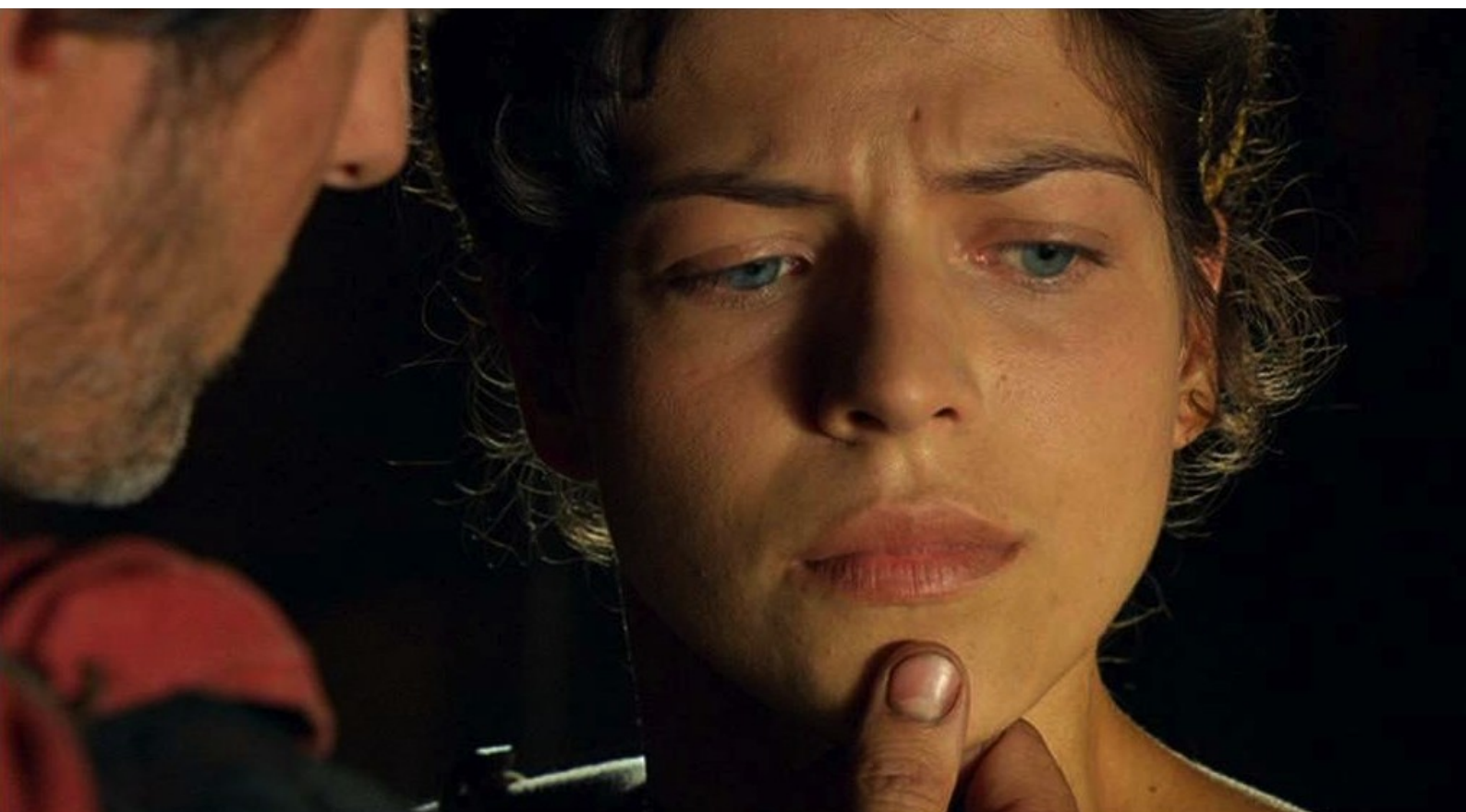
Hispania, la Leyenda : Marco, pour faire parler Gaia,