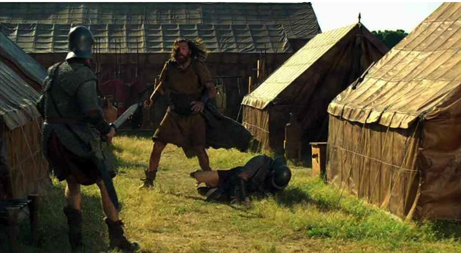
Hispania, la Leyenda : la lutte est ardente et noire,