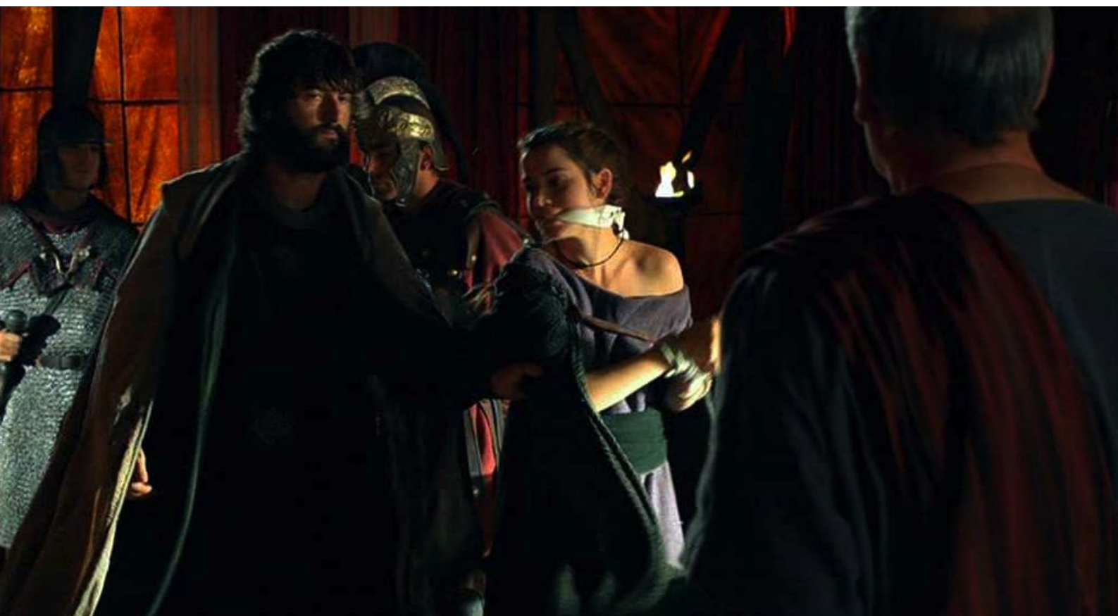
Hispania, la Leyenda : et lui remet la captive...