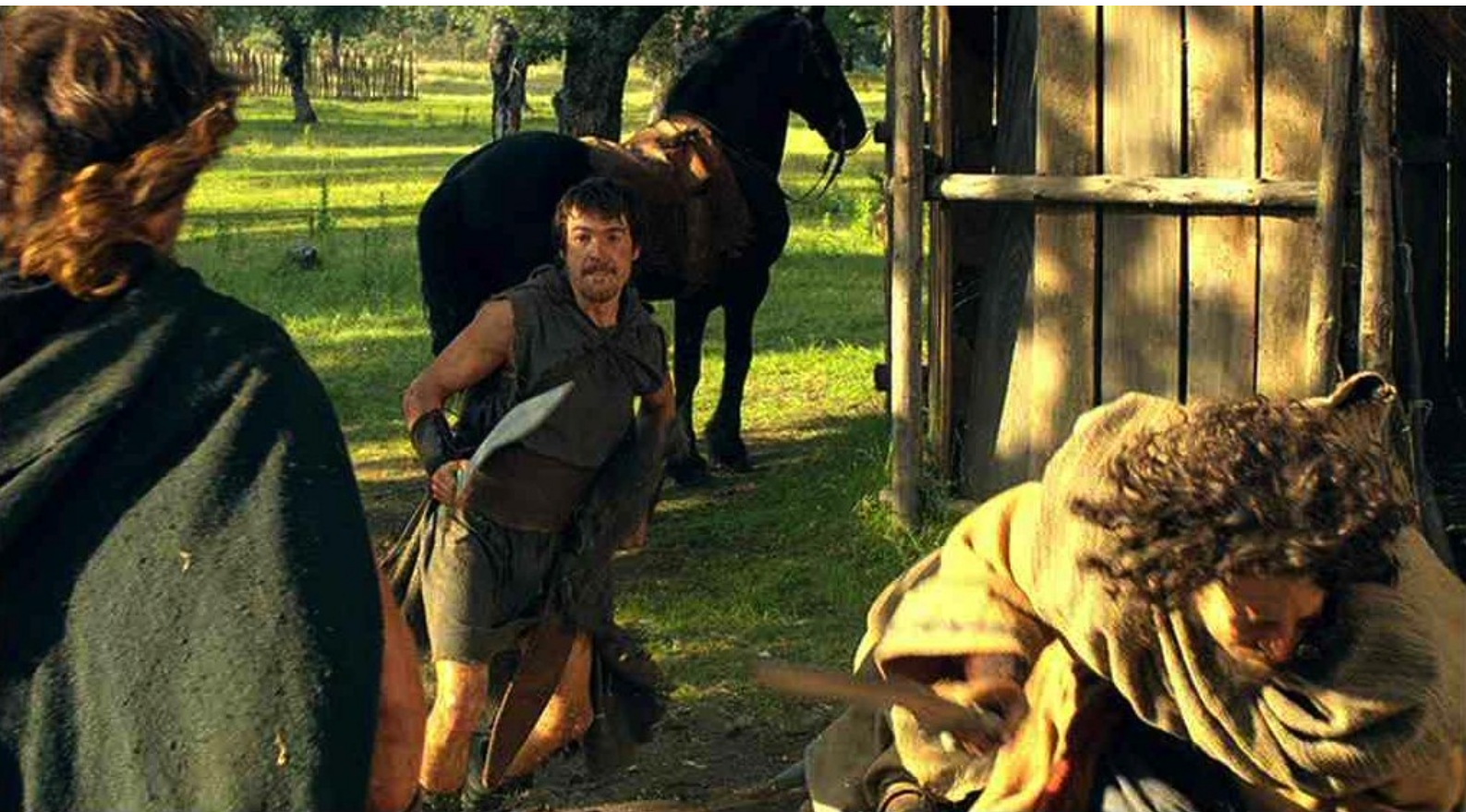
Hispania, la Leyenda : dégage sa falcata, blesse quelques ennemis,