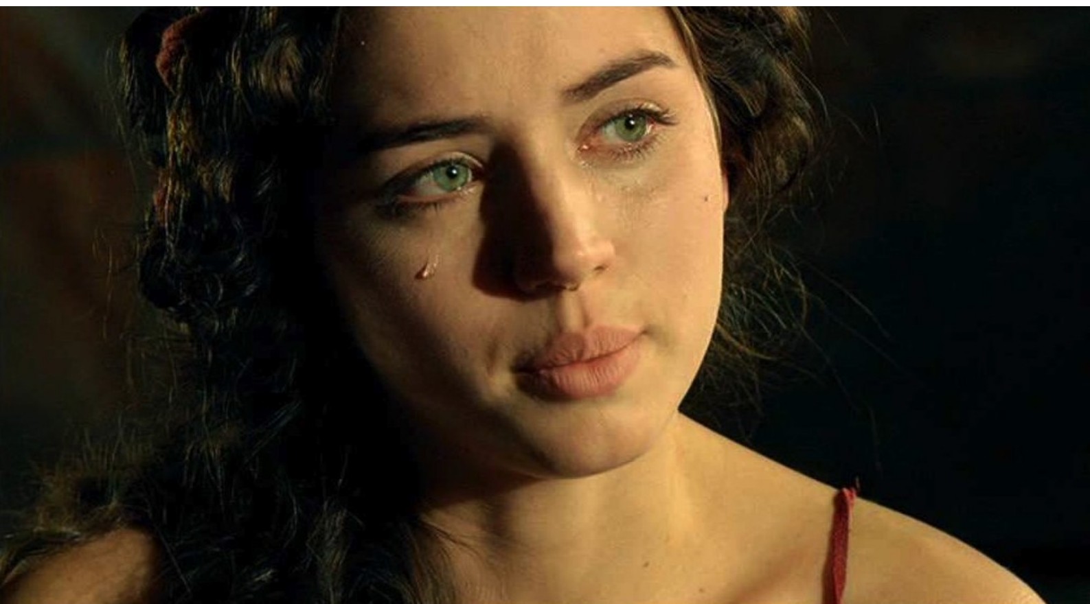
Hispania, la Leyenda : qui voudrait tarir ses larmes.