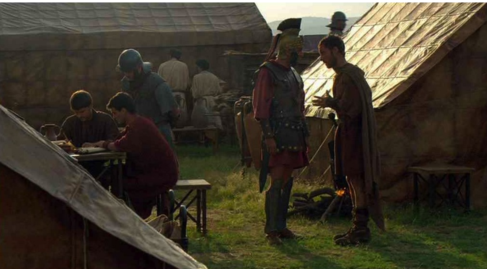
Hispania, la Leyenda : puis l'avait dénoncé à un officier.