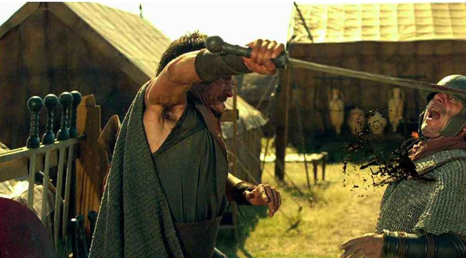
Hispania, la Leyenda : et reprend le combat ;