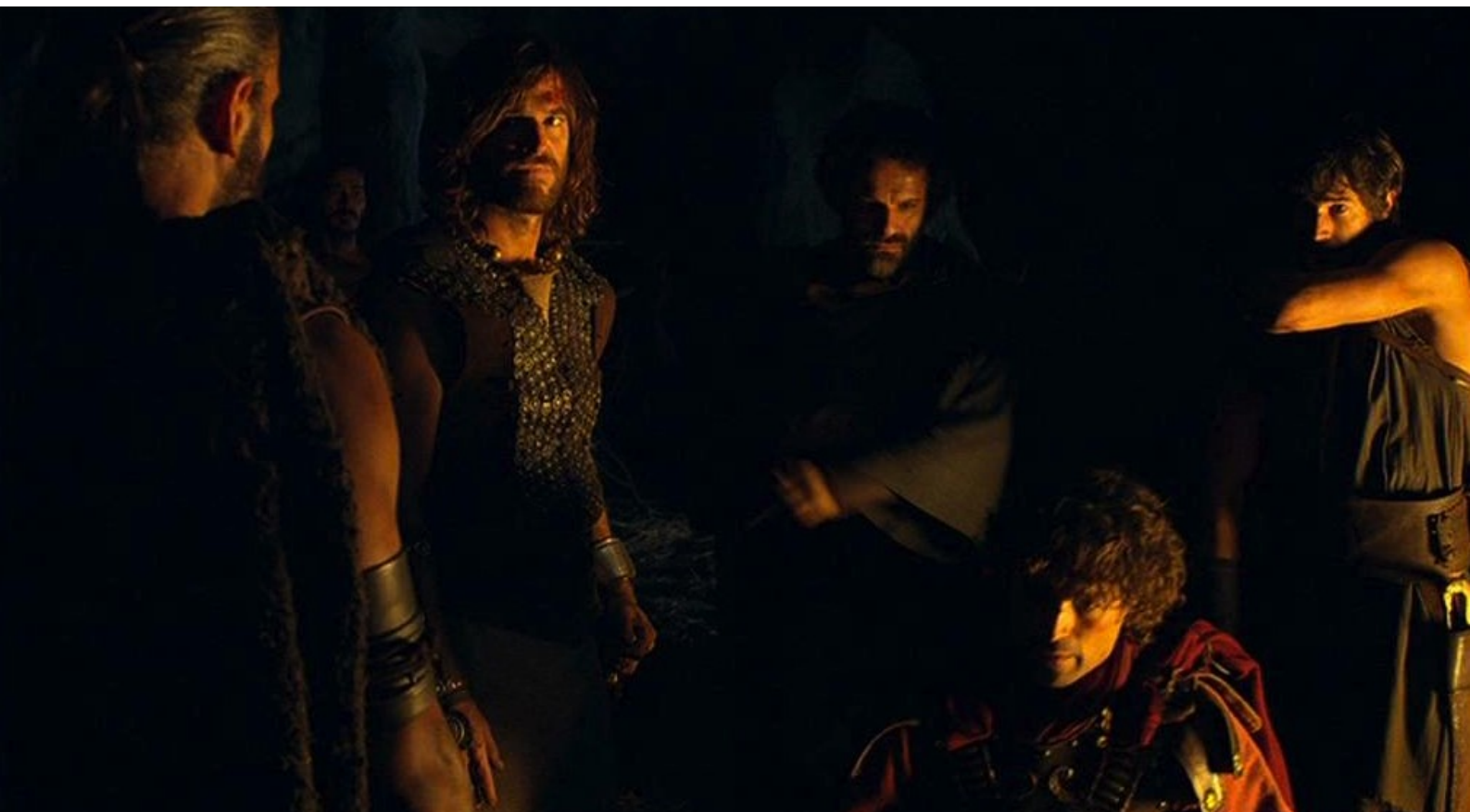
Hispania, la Leyenda : et le fait admettre au repaire.