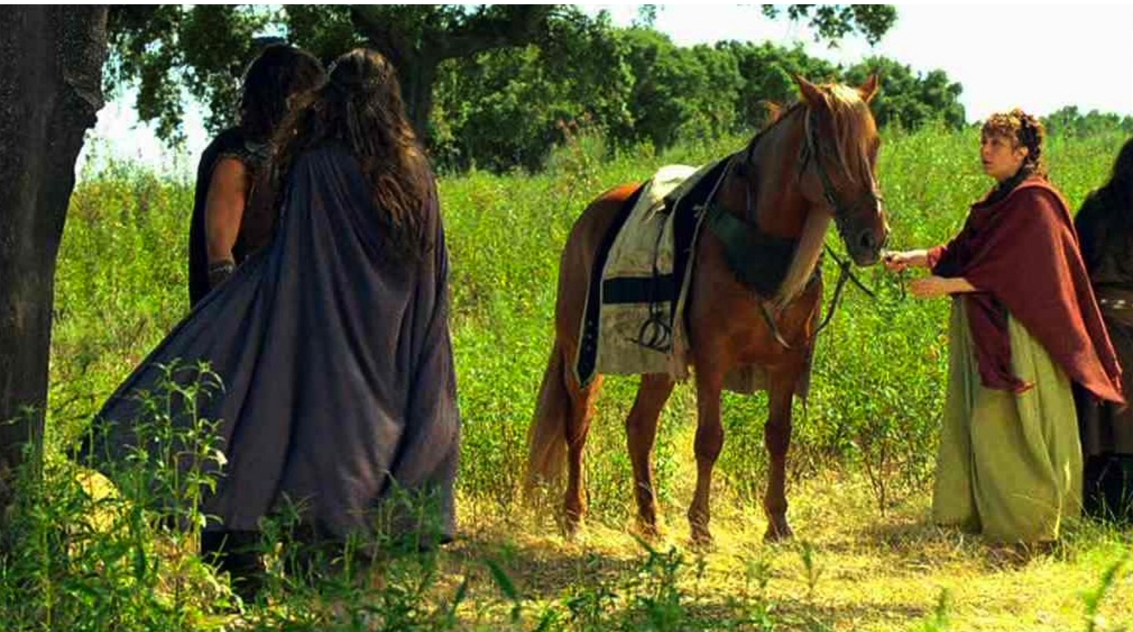
Hispania, la Leyenda : et on lui donne un cheval pour regagner le camp.