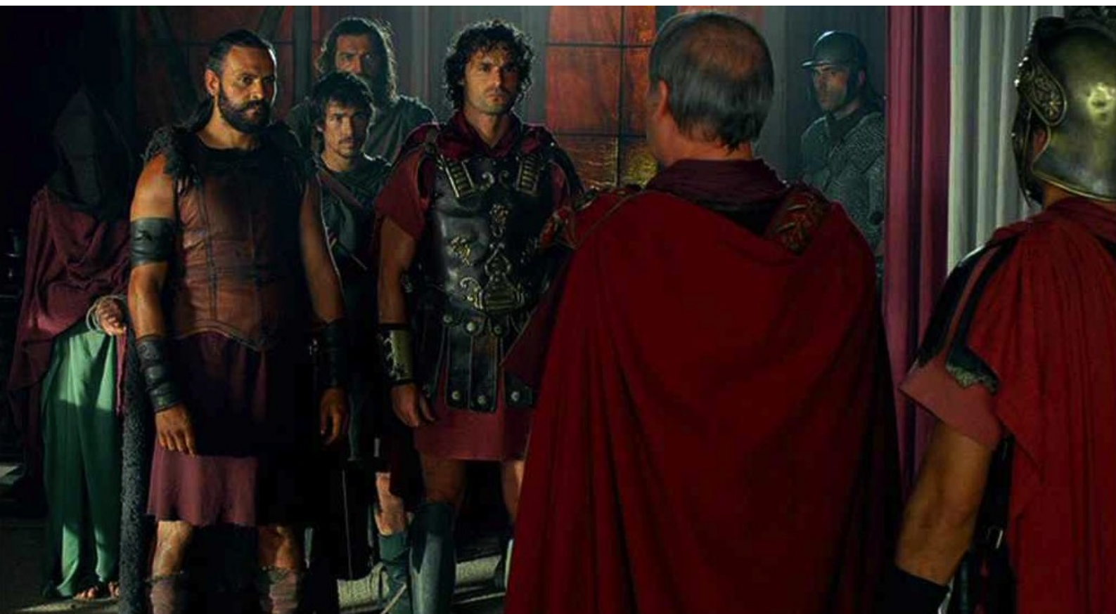
Hispania, la Leyenda : qui les introduit devant Galba.