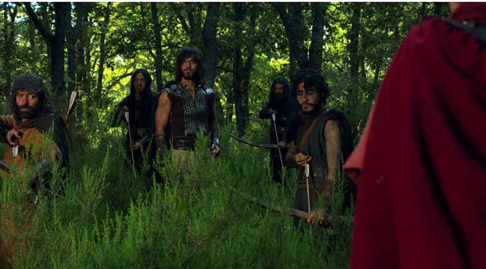
Hispania, la Leyenda : mais Dario intervient...