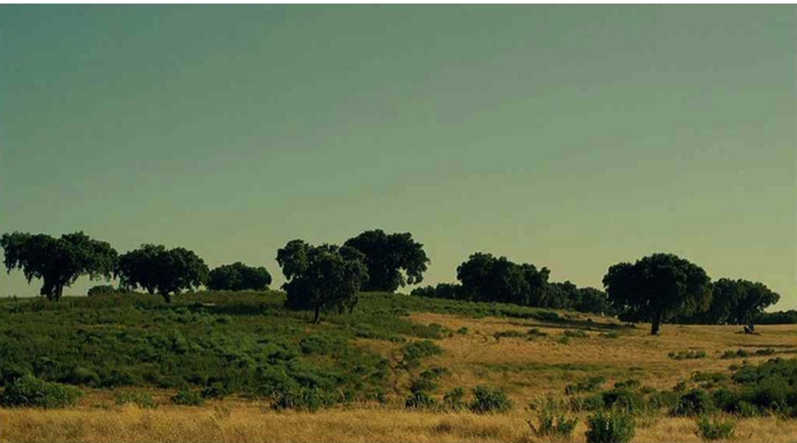
Hispania, la Leyenda : et disparaît.