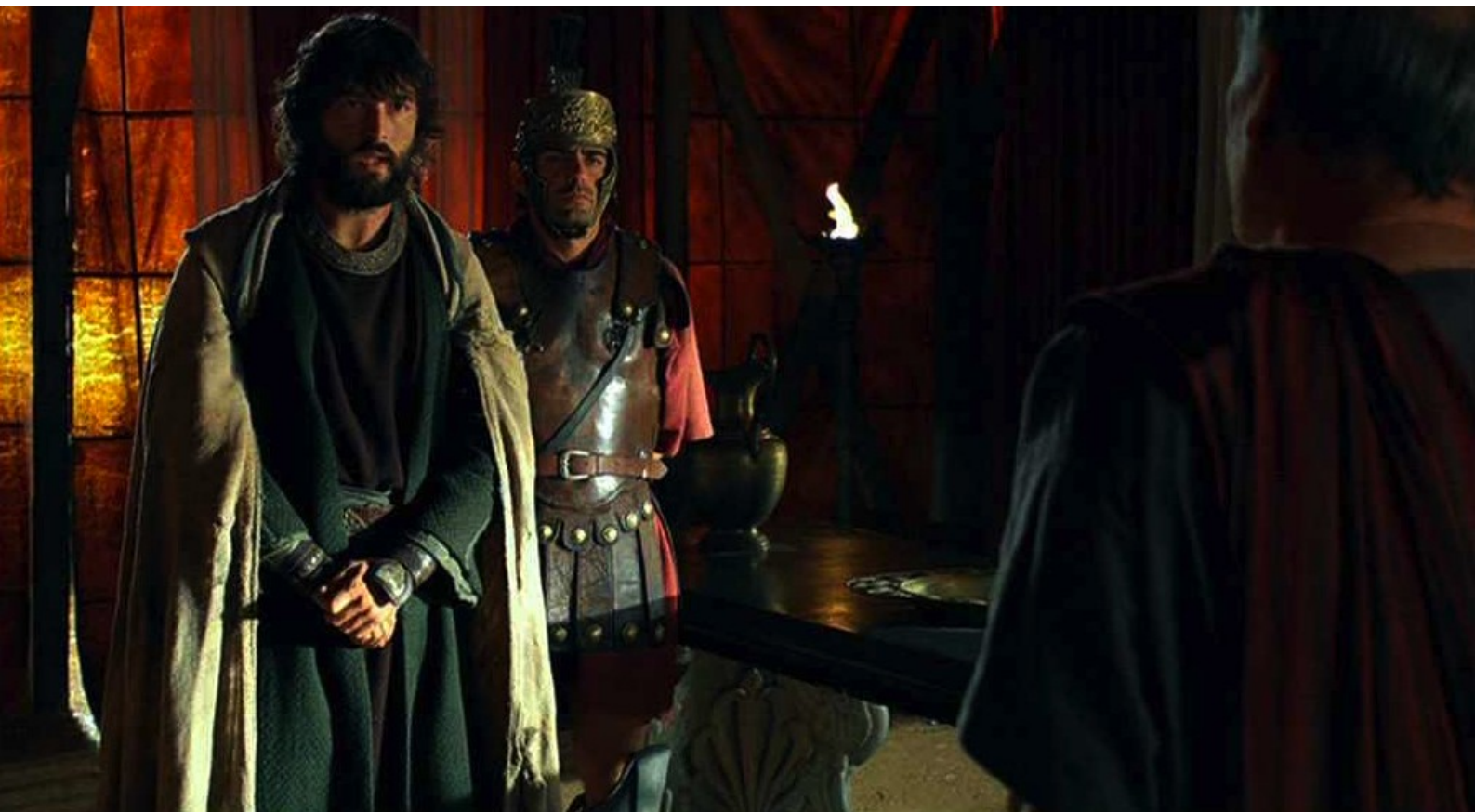
Hispania, la Leyenda : Il s'empresse d'aller chez Galba...