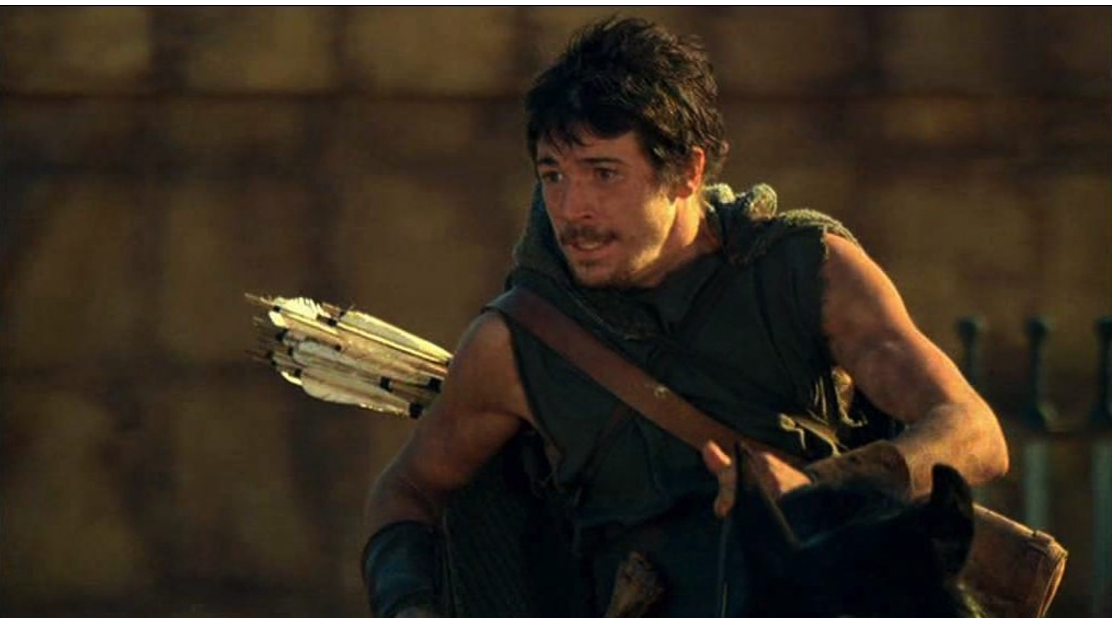
Hispania, la Leyenda : Il retourne dans le camp,