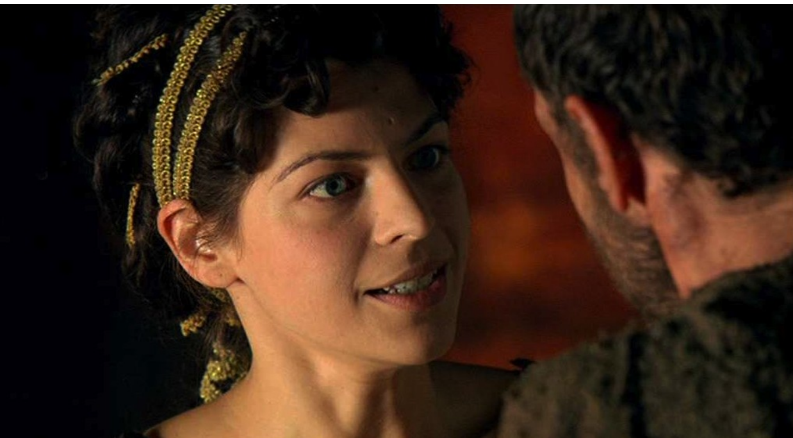
Hispania, la Leyenda : à Gaia, suspectée d'avoir aidé la fuite de Fabio.