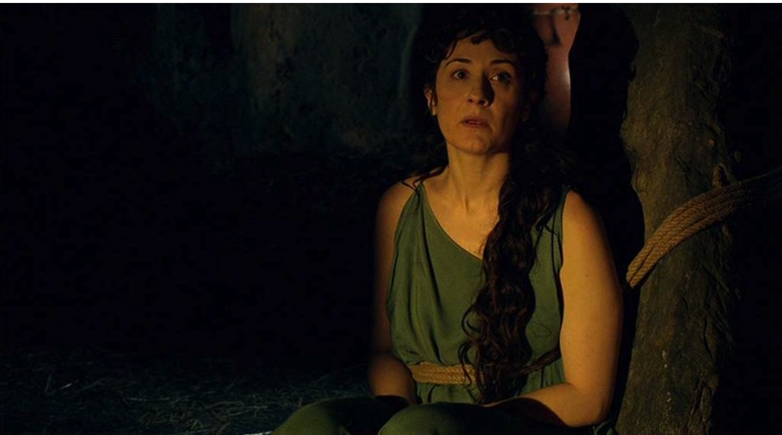
Hispania, la Leyenda : Alors Claudia révèle à Viriate et Helena que leur bébé est vivant captif au camp,