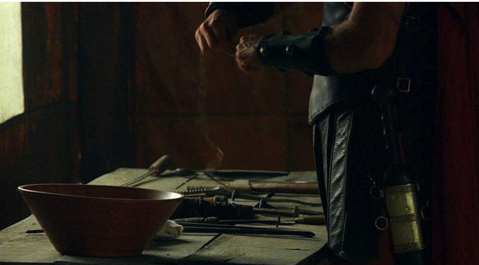
Hispania, la Leyenda : prépare des instruments de torture...