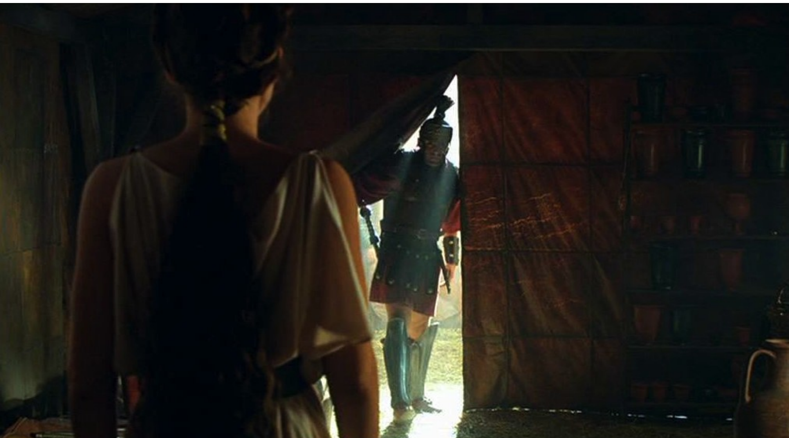
Hispania, la Leyenda : Mais on vient chercher la jeune esclave pour interrogatoire,