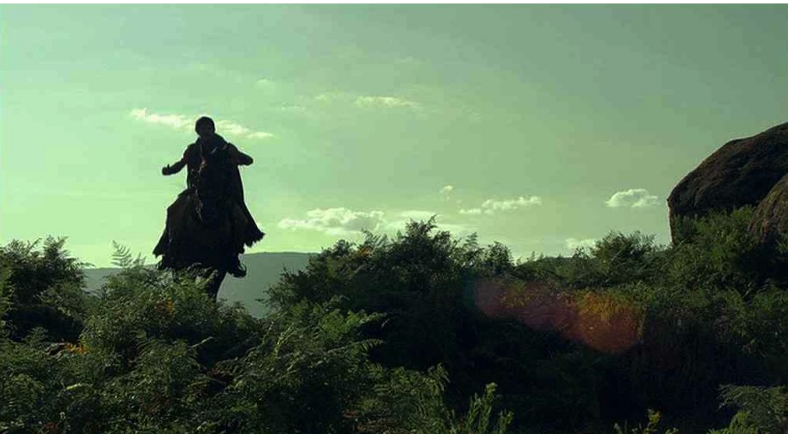
Hispania, la Leyenda : puis il galope jusqu'au repaire,