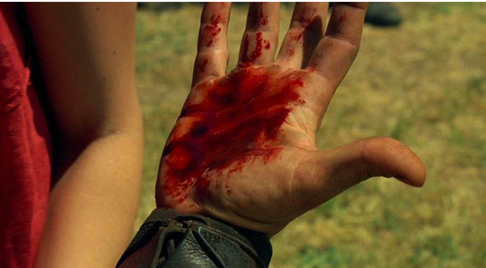
Hispania, la Leyenda : qui retire sa main ensanglantée...