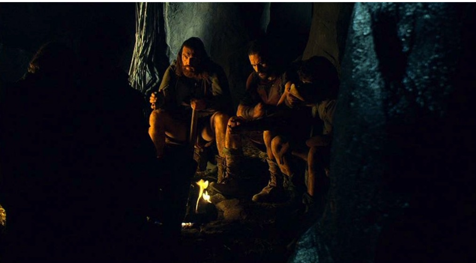
Hispania, la Leyenda : Nerea étant prisonnière, les rebelles discutent au repaire...