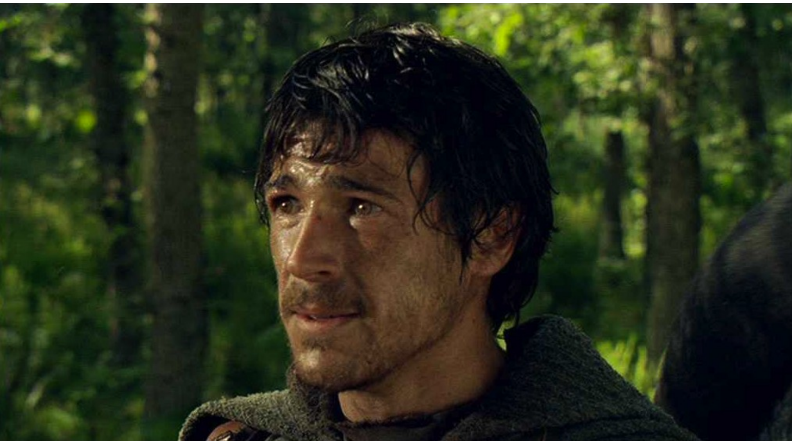
Hispania, la Leyenda : cherche en vain sa fiancée ;