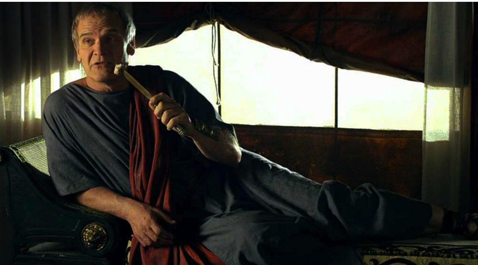
Hispania, la Leyenda : Ainsi, Galba triomphe.