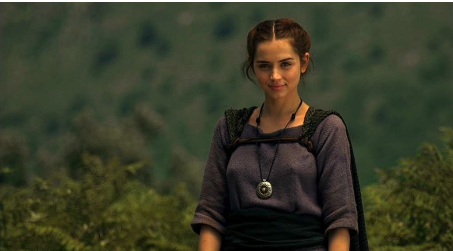
Hispania, la Leyenda : elle fait un ultime sourire...