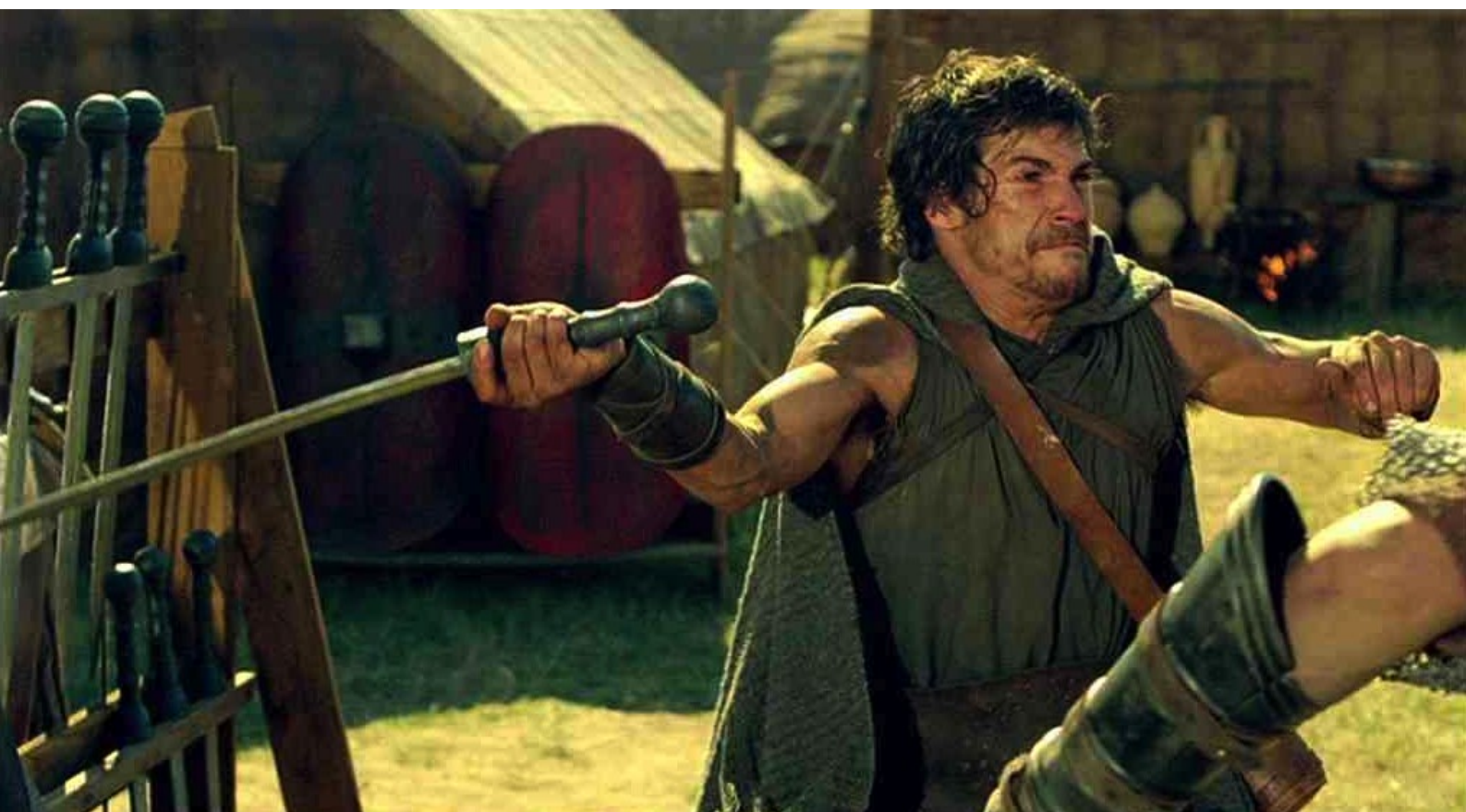
Hispania, la Leyenda : Quant à Paulo, plein de rage, il saisit une épée...