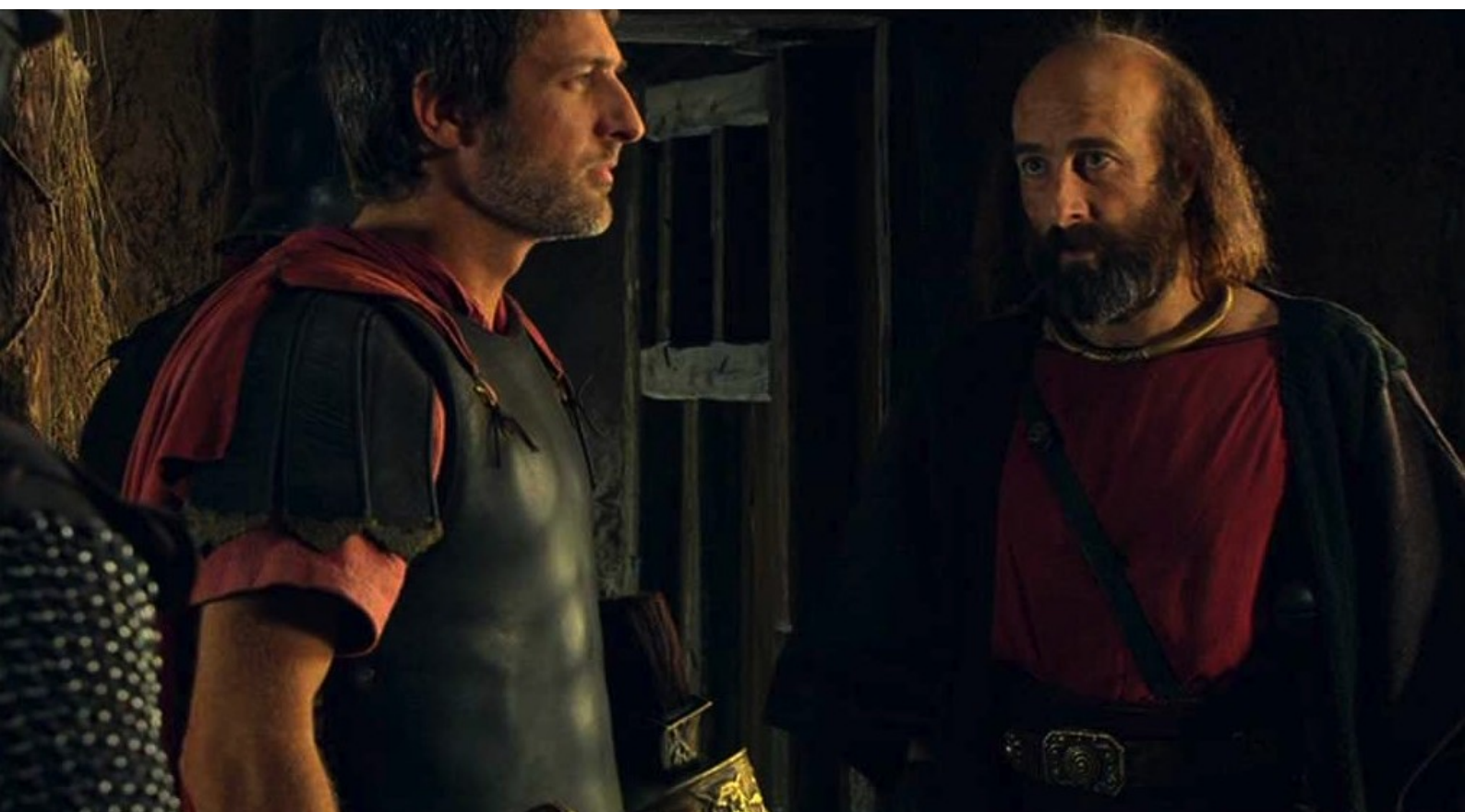
Hispania, la Leyenda : En ce qui concerne l'échange Claudia-Serbal, Marco et Teodoro conviennent...