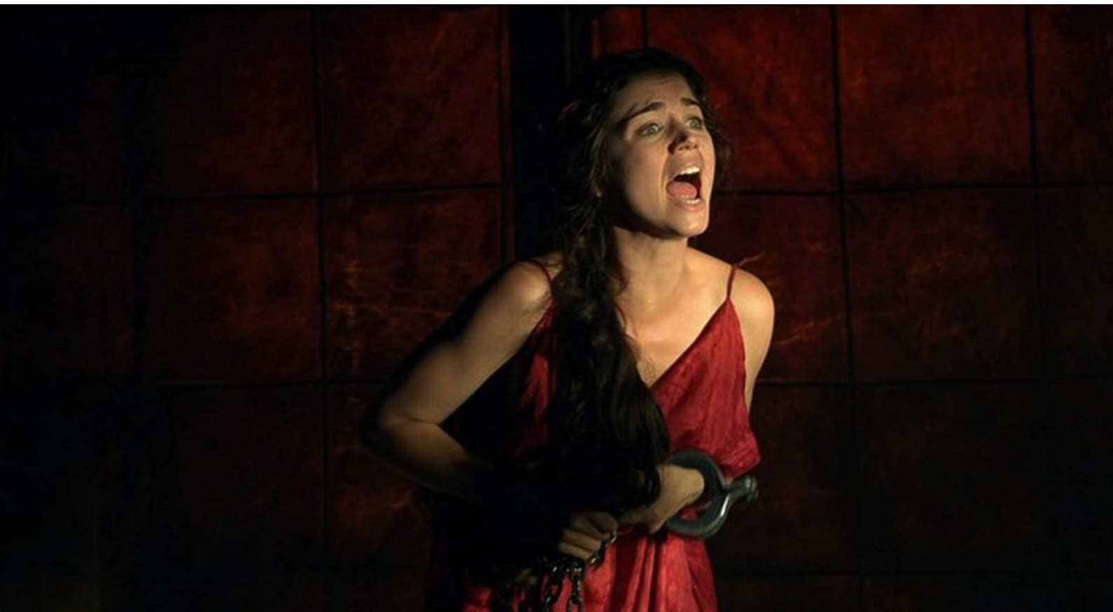
Hispania, la Leyenda : Nerea appeler au secours.