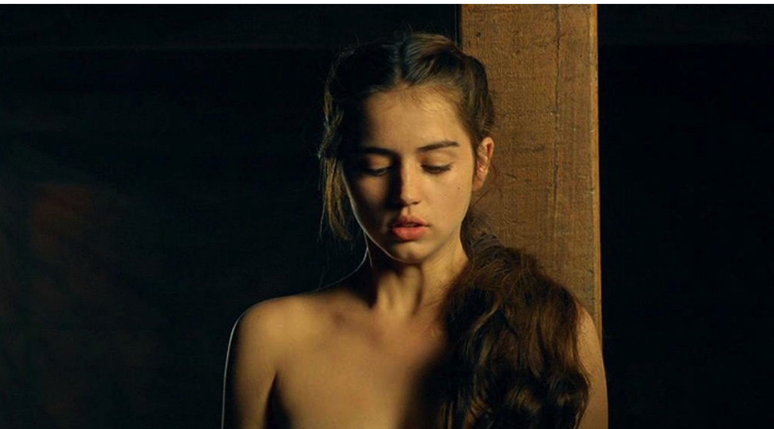
Hispania, la Leyenda : et la dénudent...