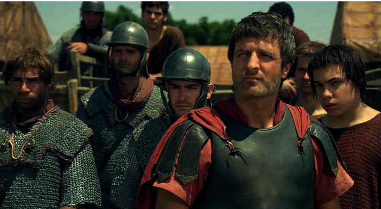
Hispania, la Leyenda : Alors Marco, pour donner un exemple,