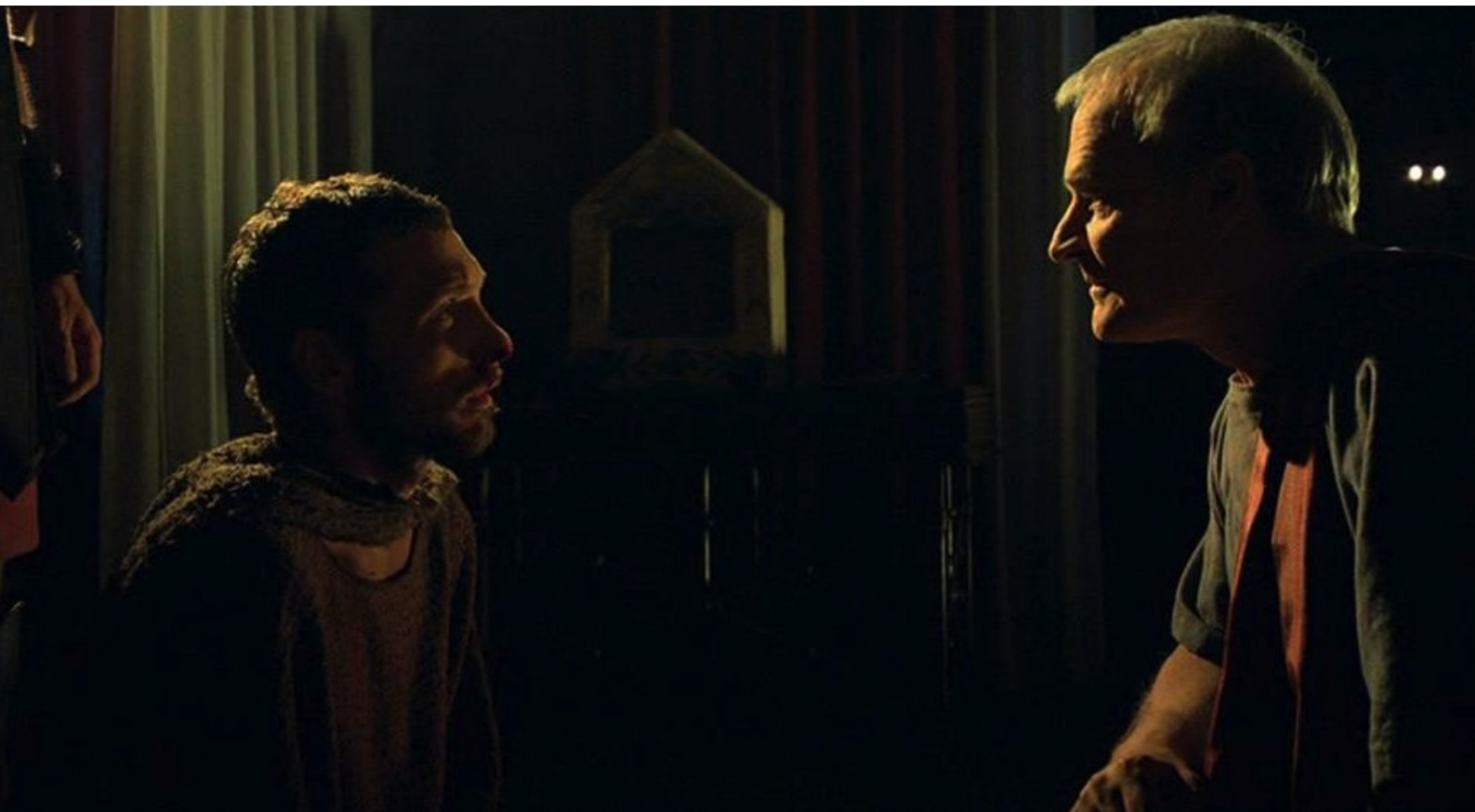
Hispania, la Leyenda : accepte la mission d'aller tuer Viriate.