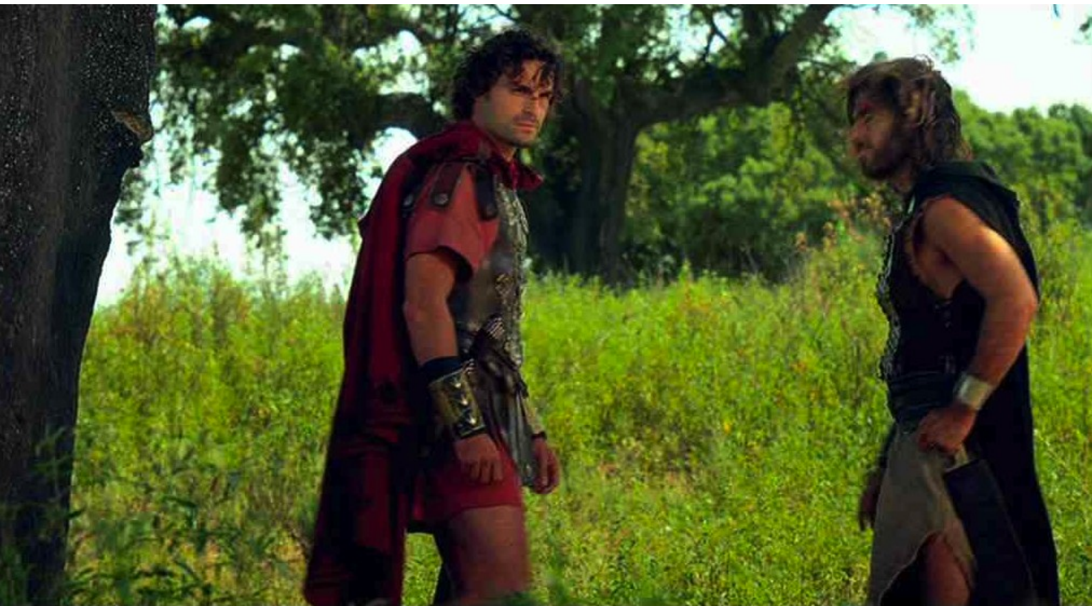
Hispania, la Leyenda : et dans la campagne : que faire ?