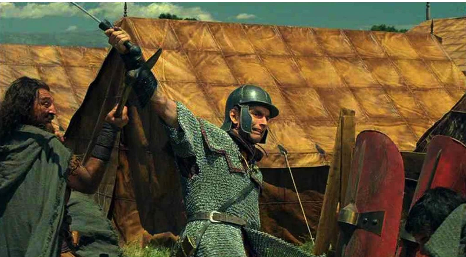
Hispania, la Leyenda : le combat s'engage,